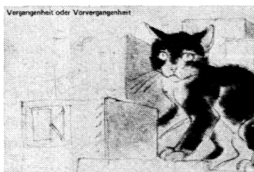
Der blinde Passagier

Drei Mappen mit Übungen zu Artwort, Begleiter, Stellvertreter und Restgruppe erscheinen Mitte 76