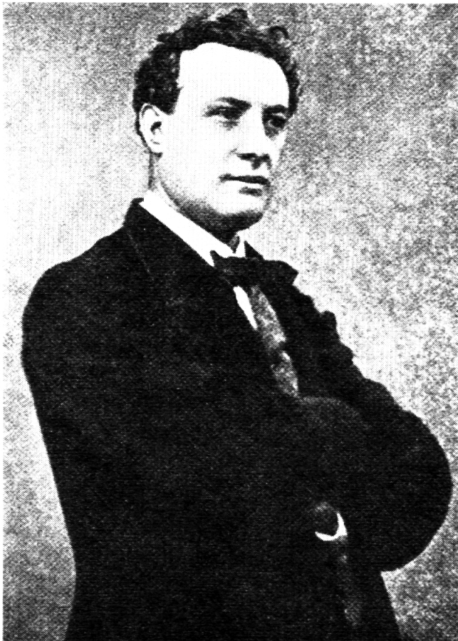
Jules Verne in seinen besten Mannesjahren

Und damit beginnt die unbeschwerte Schriftstellerlaufbahn Jules Verne's. Innerhalb von gut zehn Jahren, zwischen 1865 und 1875, folgten sich unter wachsender Begeisterung der Leserschaft in Frankreich und schon bald auch der europäischen und überseeischen Welt die eingangs erwähnten und heute noch bestbekannten Romane. Entdecker- und Forscherabenteuer mit ihren verblüffenden technischen Neuerungen und phantastischen Möglichkeiten wurden zu fesselnden Lehrbüchern der Zukunft. In Anlehnung an E. A. Poe's «The Balloon Hoax» (1844), der als erstes Beispiel von Science Fiction angesprochen wird (Evans, 155), vervollkommnete Jules Verne den satirisch-utopischen oder romanzenhaft unterhaltenden naturwissenschaftlichen und technischen