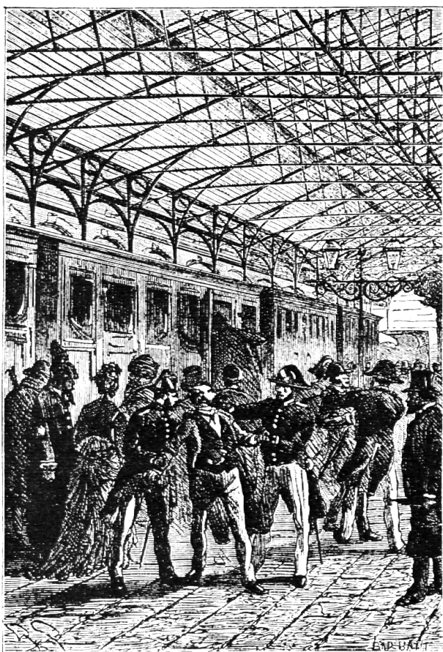
Illustration aus «Der Kurier des Zaren»

schen Verbindungen zwischen Moskau und der sibirischen Hauptstadt Irkutsk sind unterbrochen. Nur eine eilige Botschaft aus Moskau vermag den Großfürsten von Irkutsk, den Bruder des Zaren, aus höchster Gefahr zu erretten. Michael Strogoff wird auserwählt, die lebenswichtige geheime Botschaft zu überbringen. Strogoff kämpft sich inmitten der Kriegswirren gegen Osten vor, wobei er zwischen den Fronten der Heere eine ganze Reihe von