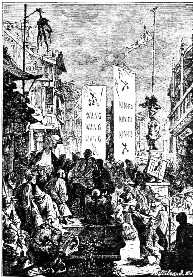
Illustration aus «Die Leiden eines Chinesen in China»

Es handelt sich hier um einen Roman mit einer überzeitlichen Aussage. Der Roman