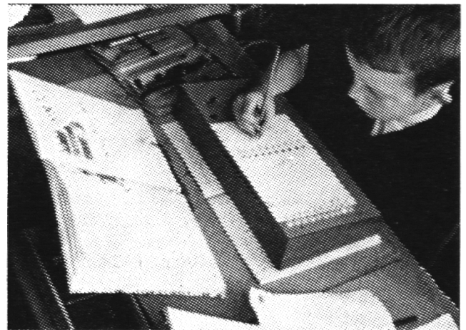
Die Arbeit am Mini-Tutor schafft gleichzeitig Kontakt mit der Welt der Technik. Welche Begeisterung für einen Knaben, mit einer Maschine lernen zu dürfen.

Von den Philipps-Werken wurde der mit Batterien betriebene Mini-Tutor entwickelt. Er ist leider noch zu teuer und enthält zu wenig deutschsprachige Programme. Der Apparat ermöglicht es, in zwei Phasen zu arbeiten. In der Lernphase zeigt ein aufleuchtendes Lämpchen dem Schüler die richtige Antwort.