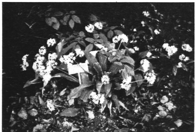
Abb. 2. Bärlauch