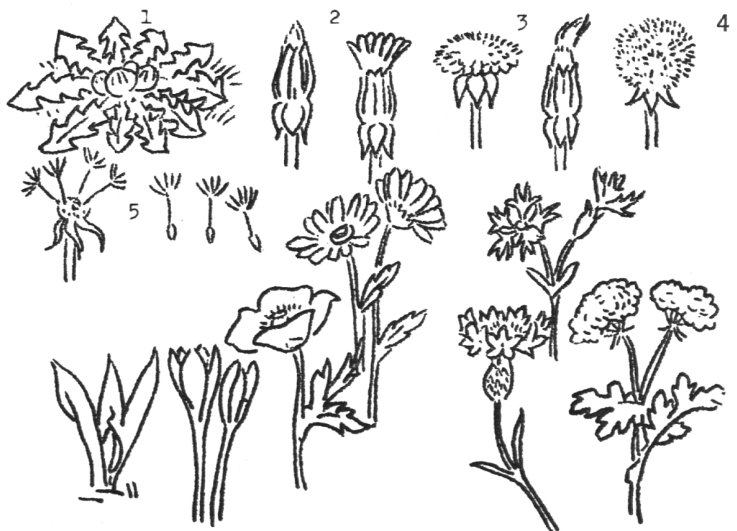
Löwenzahn: 1. Blattrosette 2. Knospe 3. Blüte 4. Fruchtstand 5. Samen Wucherblume Kuckucksnelke

Die Schüler fragen sich gegenseitig oder gruppenweise ab. Erschwerung: Die Blumen sind falsch etikettiert und müssen in die richtigen Zettel gesteckt werden, oder bei einzelnen Blumen sind die Farben vertauscht usw. – Damit verlorene Zettel in richtiger Schreibweise ersetzt werden können, erhalten die Schüler das Arbeitsblatt <Blumen in Feld und Wald>, worauf die Blumen nach Farben und ungefährender Reihenfolge der Blütezeit geordnet sind. Jede Blume, die wir kennengelernt haben, unterstreichen wir mit der entsprechenden Farbe. So zeigen sich auch Früh- und Spätblüher. Jede halbe Woche nehmen die Kinder ihre Blumen nach Hause, prägen sie sich dort nochmals für eine Klausur ein und putzen die Gefäße. – Ein Wandaushang mit guten Reproduktionen (z. B. Pflanzenatlas Schumacher in <Handharmonika>-Faltung) dient ebenfalls der Einprägung. – Bei der Klausur wird ein gutes