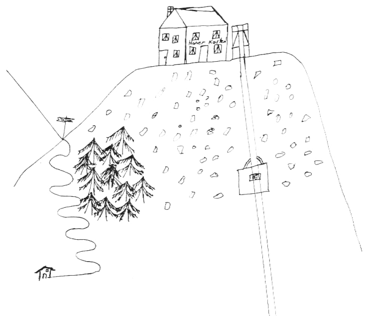
«Berg mit Bahn» (Hoher Kasten) – 4. Kl.

Die ursprüngliche Volksschule hatte den zweiten Weg eingeschlagen. Es ging ihr grundsätzlich nicht darum, die Vorstellungen des Kindes zu erweitern, sondern das Abc einzuprägen, schreiben zu lehren und zu rechnen. Die notwendigen Texte stammten aus dem religiös-sittlichen Anschauungskreis. Trotzdem bestand auch damals die Gefahr des bloßen Wortemachens seitens des Lehrers und des einseitigen