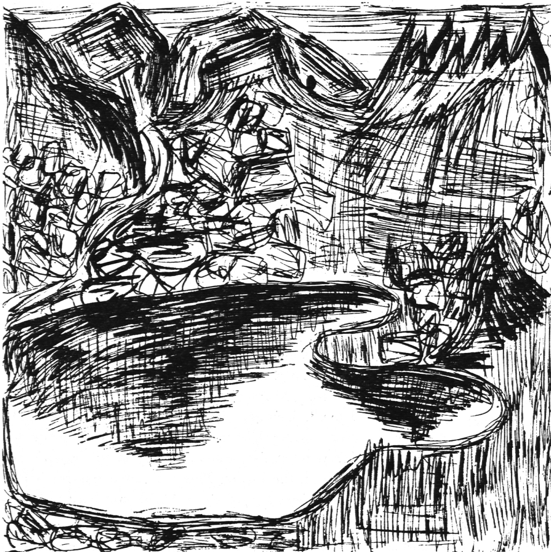
«Tomasee» 6. Kl. Mädchen

Die Grenze zwischen Untertoggenburg und Kanton Appenzell bildet der Weißenbach, der in einer überaus romantischen Schlucht die beiden verwandten Landschaften voneinander scheidet. Man kann von einer Holzbrücke, die Schwänberg und Egg-Flawil miteinander verbindet, absteigen und wandert dann bachaufwärts, vorbei an Waldbächen, an einem aufgestauten Schluchtsee und über eine an einer steilen