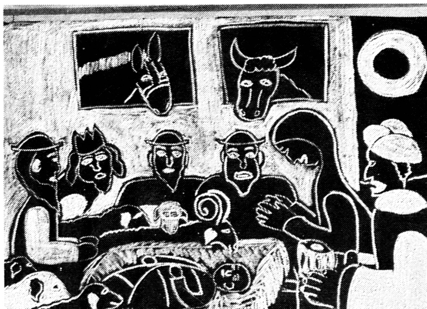
«Die Geburt Jesu». Dieses Thema spricht die Seele an. Zu beachten ist die Schwarz-weiß-Verteilung. Eine graphisch vollendete Gestaltung.

Stieger aber gibt uns keine Rezepte. Es geht ihm um eine Grundhaltung. Wer diese versteht, weiß wie vorgehen. Die Grundhaltung zu formulieren aber überlassen wir ihm. Er sagte in einem Vortrag an der Pädagogischen Hochschule zu Coburg: «Das Herz der Kinder denkt tiefer als der Verstand der Erwachsenen. Die Gegensätzlichkeit zur intellektuellen und technischen Elementarerziehung kommt vielleicht nirgends so klar zum Bewußtsein wie in der Bibelstelle: Wenn ihr nicht werdet wie die Kinder, so werdet ihr nicht ins Himmelreich eingehen. So demütig sind wir Erwachsenen nicht. Wir sagen eher: Wenn ihr nicht werdet wie Erwachsene, so werdet ihr nicht glücklich werden in eurem Leben. – Wie Schriftgelehrte und Pharisäer versuchen wir bestän-