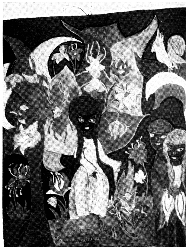
<Vertreibung aus dem Paradies>. Solche Bilder zaubert das Kind lächelnd hervor, so, wie es einen Schmetterling bewundert. Es bleibt ein Geheimnis.

* Vgl. auch <Das Herz der Kinder denkt tiefer als der Verstand der Erwachsenen> von Karl Stieger in <Schweizer Schule> 1959/60, S. 530 ff., 649 ff., 776 ff.