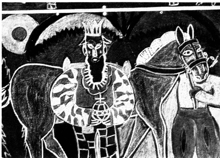
Wir Erzieher sind hier die Empfangenden, nicht die Gebenden. <Ein der drei Heiligen Könige schreitet zum Stall hin.>

täglichen Raschelatmosphäre. Stieger hat einen Weg. Wem der Grundsatz dieses neuen Weges im Geiste aufgegangen ist, der fühlt sich angerufen, selbst schöpferisch zu werden oder schöpferische Kräfte zu entdecken und zu entfalten. Das setzt den starken Glauben an die Kraft der Seele voraus. Stieger schreibt: «Das Schöne, das Wahre und das Gute