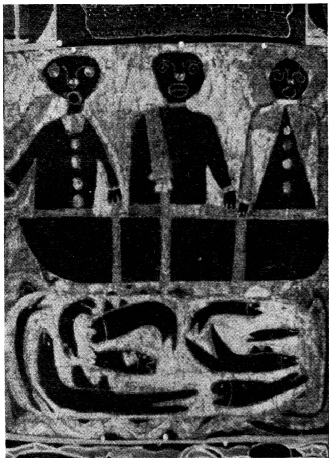
Der reiche Fischfang.

bar. Das Schöne hat Ausdruck gefunden und verzaubert alle Wände des Raumes mit Bildern, die das Geistige wehevoll ausstrahlen.»