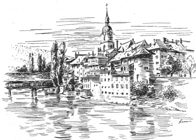
Olten ist nicht nur ein Eisenbahnknotenpunkt und Industrieort, sondern ein reizendes altes Städtchen mit einer Holzbrücke und Ausgangspunkt herrlicher Jurawanderungen.

Form, die wir am besten mit einem Vogel vergleichen. Der Kopf liegt im weit abgelegenen Kienberg, der eine Flügel dehnt sich aus gegen Basel und die Burgundische Pforte, der andere gegen die bernische Kornkammer im Fraubrunneramt. Das Rückenmark wird gebildet von der Aare und der Dünnern mit ihren Seitenbächen. Die zähen Knochen sind wohl die markanten fünf Jurakämme, während die feineren Knöchel im Süden hinaus ragen ins bucheggbergische Hügelland oder im Norden zur Burgundischen Pforte. Die Grenzen sind unübersichtlich, Enklaven ragen sogar zur französischen Grenze hinaus. Bernische und basellandschaftliche Gebiete drängen im Birstal weit in natürliche Grenzzüge hinein, und auf der Südseite hat das bernische Bipperamt sogar bis zum Kamm der ersten Jurakette vordrängen können. So kann die Kantonshauptstadt auf Hauptstraße und Bahn von Osten her nur über fremdes Gebiet erreicht werden. Die Ursache dieser Zersplitterung liegt im Kampf um die Selbständigkeit der alten Stadtrepublik Solothurn. Die politischen Bauleute haben ein unfertiges, großangelegtes Gebäude aufgemauert, doch der Ausbau scheiterte am Widerspruch der starken, machtgerigen