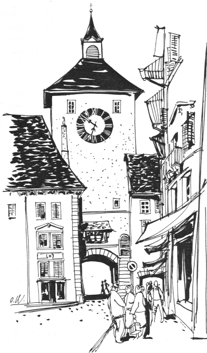
Solothurn, Bieltor von innen. Tuschzeichnung von Prof. O. Wyß

Mit Bewilligung der solothurnischen Verkehrsvereinigung.