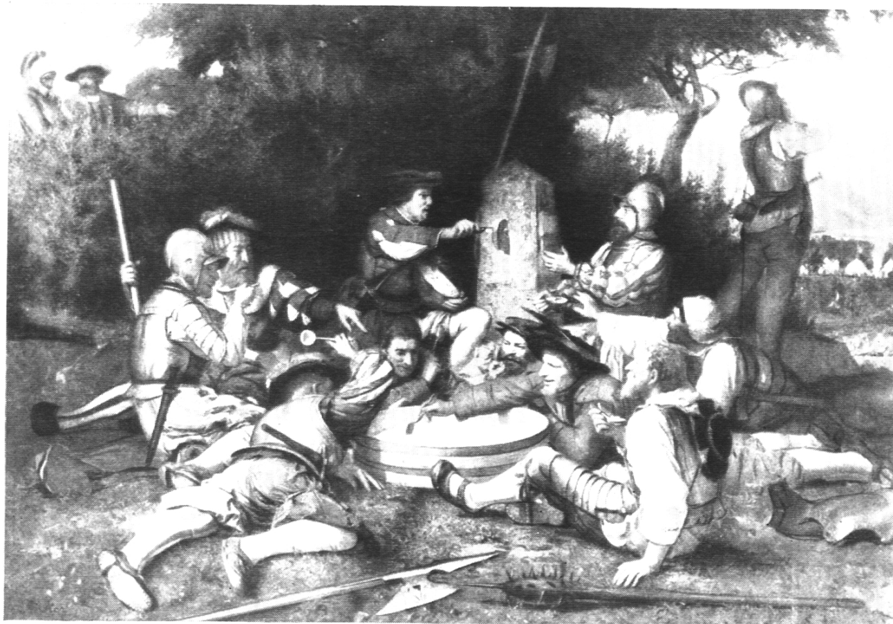
Bundesfeier-Karte Carte de la Fête nationale Cartolina della Festa nazionale

Il Servizio filatelico della Direzione generale PTT a Berna bolla, alla data del giorno d'emissione, gli invii affrancati con soli francobolli Pro Patria e impostati il 31 maggio entra busta affrancata recante l'indirizzo del servizio stesso e la scritta «Bollatura del giorno d'emissione». Quest'impostazione può essere fatta a qualsiasi ufficio postale svizzero. Il bollo apposto dall'ufficio d'impostazione è determinante.