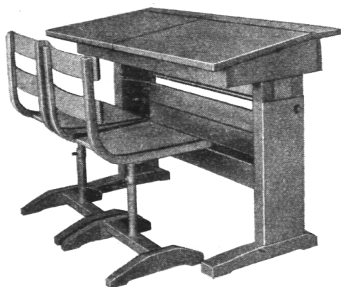
FERD. THOMA · Möbelwerkstätten Gegründet 1868 · Tel. (055) 2 15 47 · JONA/SG

In einfachem Stile, durch gediegene Illustrationen das Auge fesselnd, führt das handliche Büchlein von 166 Seiten in die Entwicklung und Eigen-