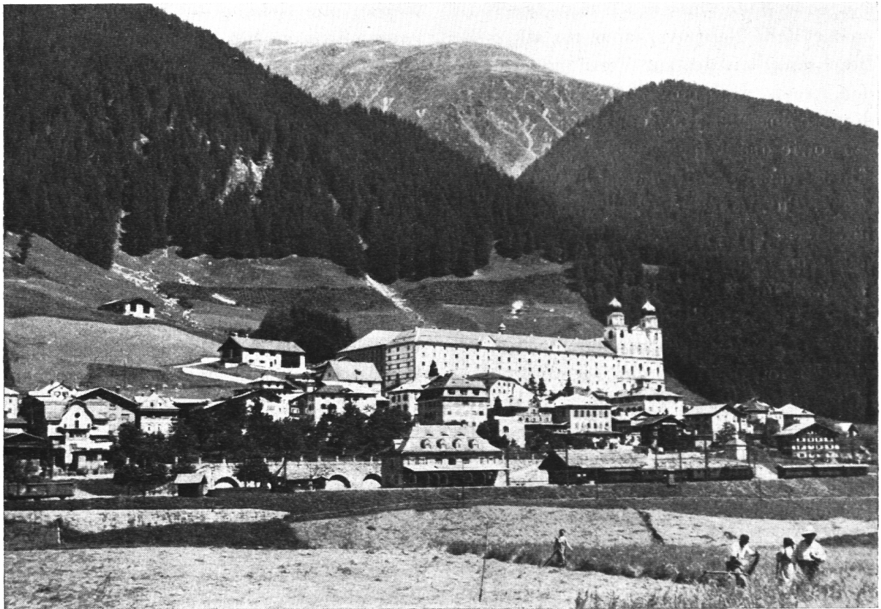
Kloster Disentis – Ursprünglich klösterliche Rodungssiedlung im graubündischen Vorderrheintal.

durch Despotismus und ein überzüchtetes Beamtentum, durch hohe Steuern und Abgaben, durch Wehrpflicht und Leibeigenschaft den nur oberflächlich romanisierten keltischen Bauer unterdrückt, so begrüßte er nun die Germanen als neue Herren, die ihm zum mindesten eine gewaltige Abgabenlast abnahmen und die persönliche Freiheit schenkten. Die romanisierten Pächter und Kleinbauern wurden auf diese Weise zu Lehrern der frisch angesiedelten germanischen Gebieter, an die sie die hochentwickelte Landwirtschaft, Handwerk und Gewerbe weitergaben. Der politisch unterlegene Teil erwies sich als der kulturell aktivere und reichere.