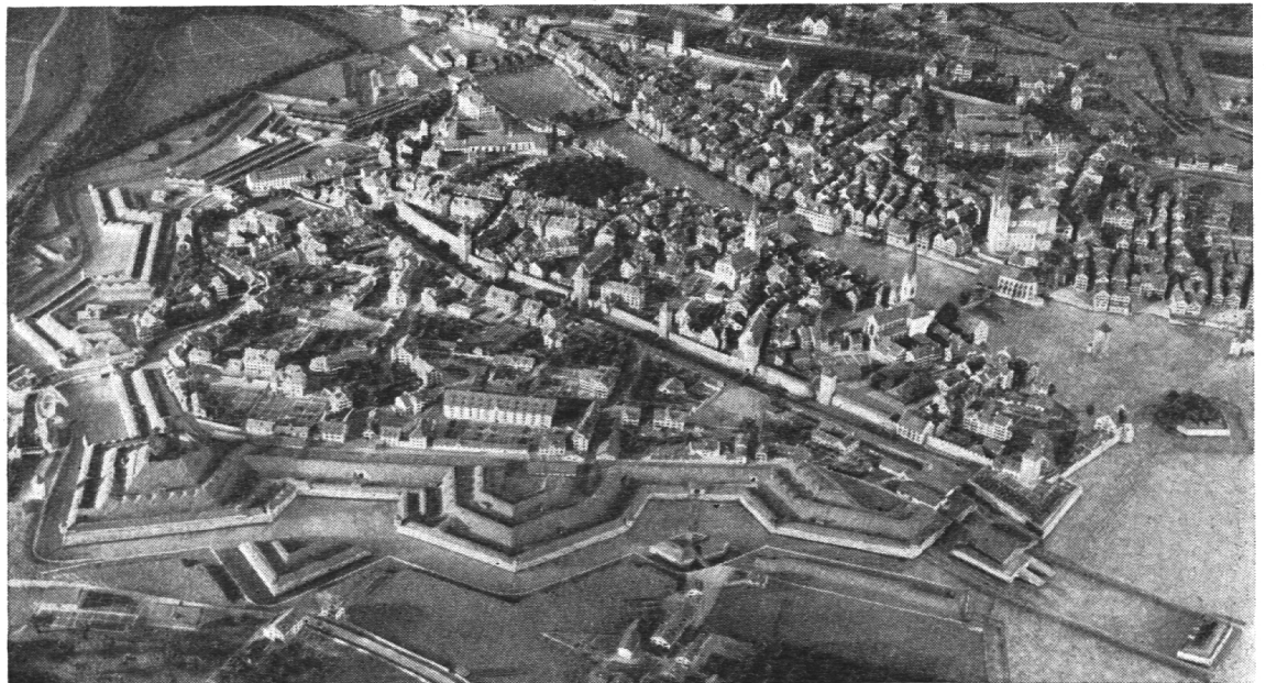
Gesamtansicht von Zürich ums Jahr 1800 (Probe-Illustration aus dem »Freund« 1949 zum Artikel »Die Stadt Zürich vor 150 Jahren«).

Dann bietet der Schülerkalender »Mein Freund« Anregung zu mannigfacher Freizeitbeschäftigung für Buben und Mädchen. Es werden 9 Wettbewerbe durchgeführt. Da haben die Schüler Gelegenheit, ihr Können unter Beweis zu stellen. Jahr um Jahr gelangen für mehrere tausend Franken Preisgaben zur Verteilung.