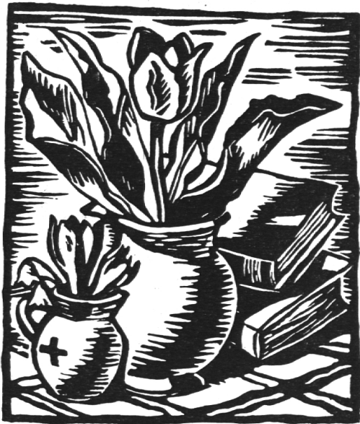
Eine Arbeit aus dem Linolschnitt-Wettbewerb 1948

»Mein Freund« stellt sich in den Dienst prächtiger Ziele und rechnet deshalb auf Ihre wertvolle Unterstützung. — Empfehlen Sie das Büchlein, bitte, bei passender Gelegenheit Ihren Schülern! Ein anerkennendes Wort von Ihnen wird kräftig zum erfolgreichen Absatz unseres Schülerkalenders beitragen. Und je größer der Absatz, desto gediegener kann der Kalender gestaltet werden.