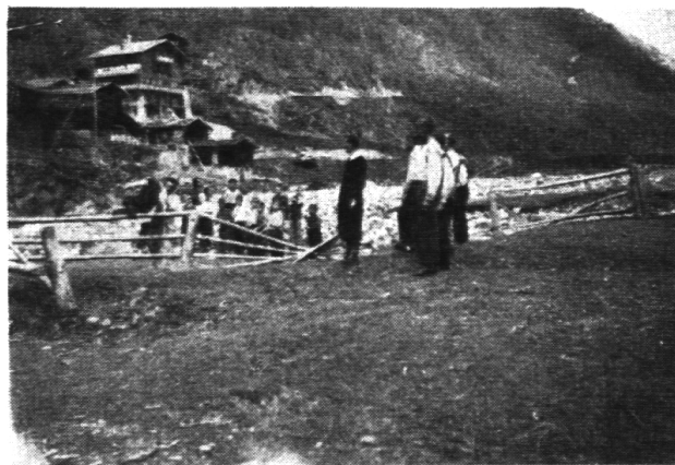
Uebungen am Stemm balken.