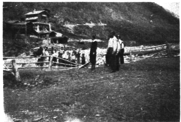
Übungen am Stemm balken.