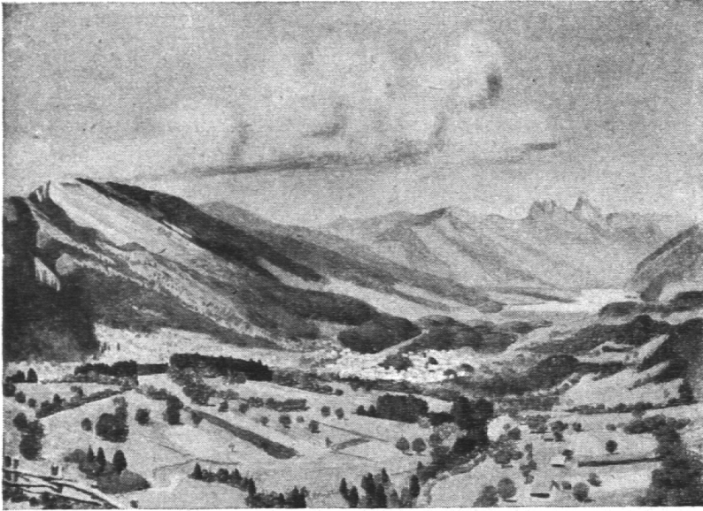
Bergsturzgebiet von Goldau. Serie: Landschaftstypen. Maler: Carl Bieri, Bern. Bürger von Schangnau (Bern), * 1894. Bild Nr. 40

Einen Meister, der sich vollkommen dem Thema unterordnen kann, ohne seine Handschrift preiszugeben, treffen wir beim folgenden Bild, das die Goldauer Bergsturz-Landschaft mit beglückender Stimmung erfasst. Von Carl Bieri stammt das meistverlangte Bild aller bisher herausgegebenen, der Faltenjura. Hier ist ein zweites, dessen Stoff in jedem Lehrplan vorgesehen ist. Der Blick in die Landschaft reicht so weit ins Schwyzerland hinein, dass man das Werk auch in der Geschichte verwenden kann. Die beiden Mythen von Westen her zu sehen, den „Kleinen“ als längern Grat, schadet auch nichts. Die Schüler sollen wissen, dass jedes Ding mehrere Seiten hat, die nicht alle gleich aussehen müssen.