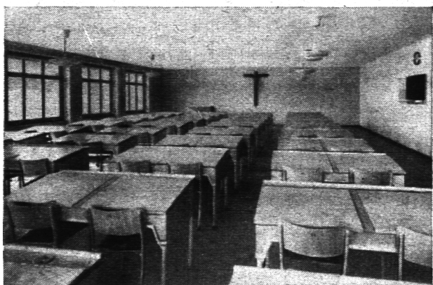
Kollegium St. Antonius Appenzell. — Studiensaal.

An die Erarbeitung der Pläne des Baues wurde nach den modernen Grundsätzen der Architektur herangetreten. Man horchte zuerst das Leben ab, das in dem Bau sich abwickeln sollte, das Leben junger Menschen in den bedeutendsten Stadien körperlicher und geistiger Entwicklung, das Leben, das sich in einer Verbindung von Schule und Internat abspielt und das sich gleicherweise aus Studium und Erholung zusammensetzt. Wer den Neubau von diesen Gesichtspunkten geleitet durchwandert, wird ihre fruchtbare und glückliche Auswirkung rasch ge-