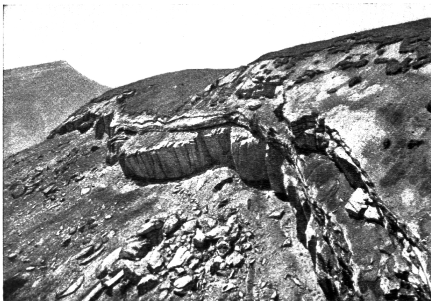
Rossbergabsturz. Nr. 4208 BRB 3.10.1939.

Zur Gemeinde Ingenbohl gehört auch der bekannte Fremdenkurort Brunnen mit seinen vielen stattlichen Gasthöfen. Am See geniesst man eine wundervolle Aussicht in die Urner- und Unterwaldnerberge und zum Rütli hinüber. Neben dem Bahnhof liegen aus-