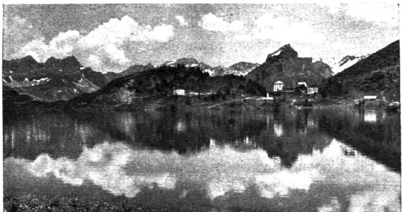
Der Trübsee oberhalb Engelberg

Wie der Schüler vom Stoff Besitz ergreift, ist die Hauptsache. Erstes Hilfsmittel: die Landkarte. Jeder Schüler liest aus ihr, was er erkennen kann; was die Karte ihm selber mitteilt, verschweigt der Lehrer. Sie ist das reichhaltigste Lesebuch. (Leider sind die stark beschrifteten Schweizerkarten etwas unleserlich; zuviele Buchstaben und Farben sind ein Hindernis des richtigen Kartenlesens.) Das freie Unterrichtsgespräch setzt ein: die Schüler erzählen, fragen, antworten einander, messen, rechnen, vergleichen usw. Der Lehrer steht im Hintergrund, er-