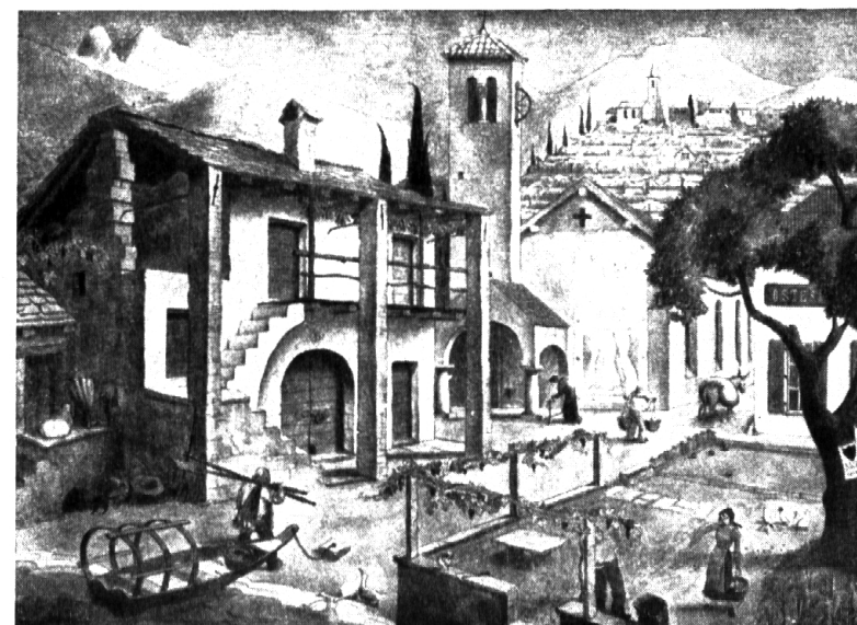
Nr. 2: Nikl. Stöcklin: Siedlung im Tessin.