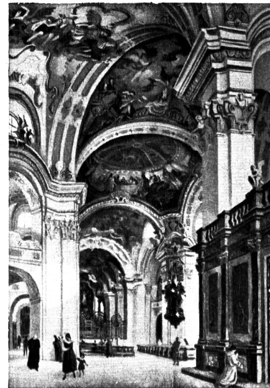
Nr. 28: Albert Schenker: Barock.