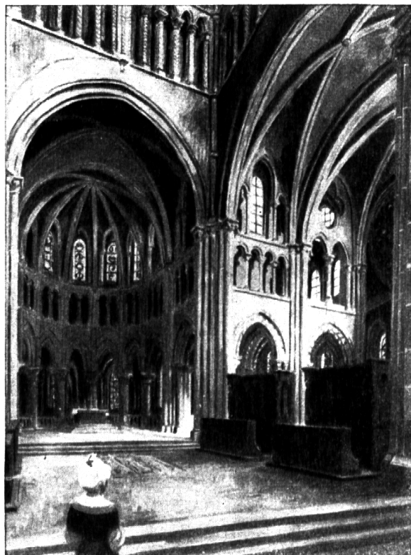
Nr. 16: Karl Peterli: Gotik.