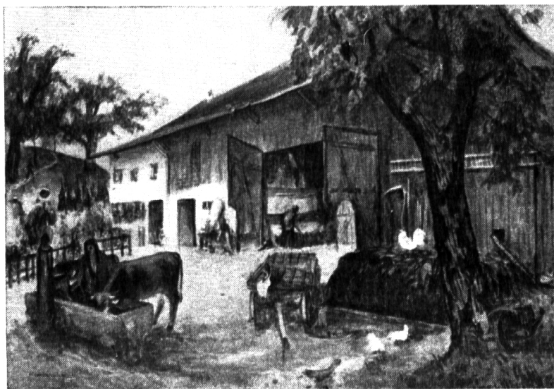
Nr. 26: Reinhold Kündig: Bauernhof (Nordostschweiz).