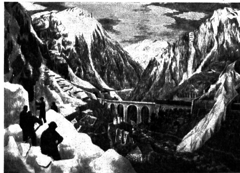
Nr. 3: Viktor Surbeck: Lawine und Steinschlag.

Schweiz. Schulwandbilderwerk: Landschaftstypen — Kampf mit den Naturgewalten.