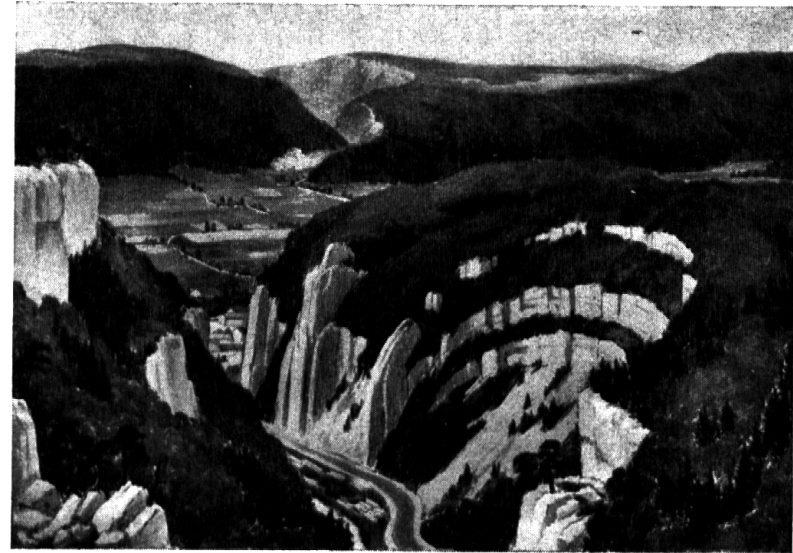
Nr. 12: Carl Bieri: Faltenjura bei Moutier.