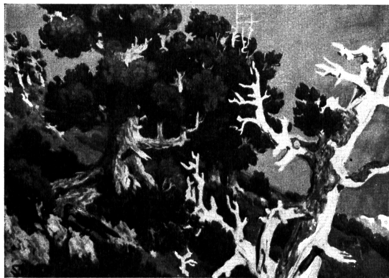
Nr. 17: Fred Stauffer: Die Arve.

Schweiz. Schulwandbilderwerk: Pflanzen und Tiere in ihrem Lebensraum.