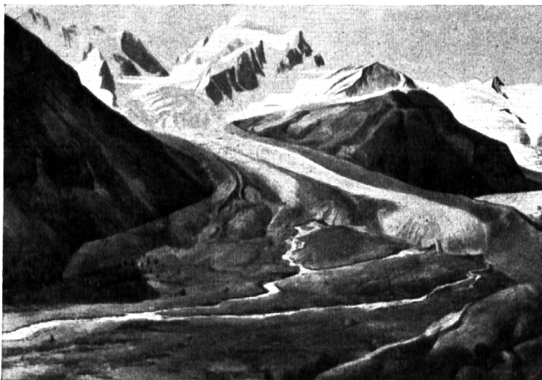
Nr. 29: Viktor Surbeck: Gletscher.