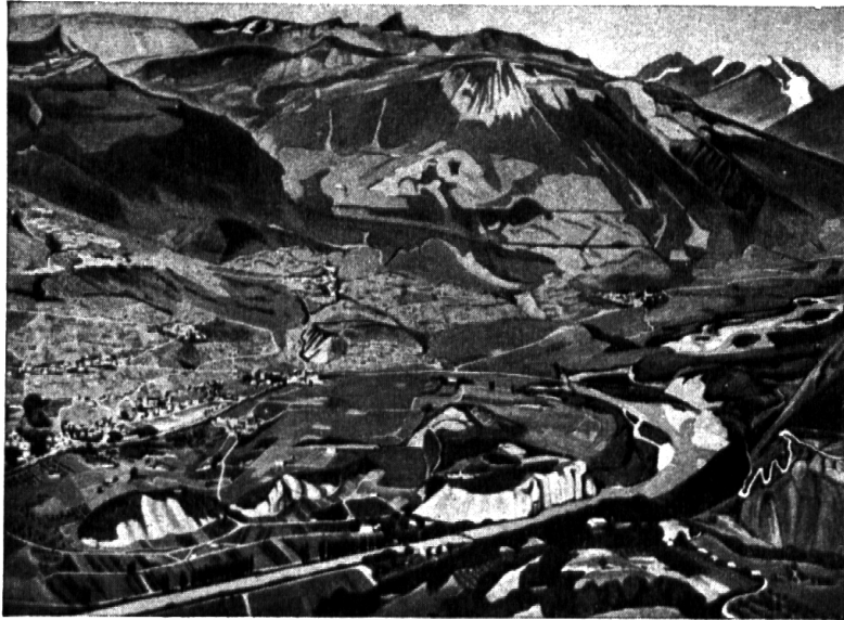
Nr. 24: Théodore Pasche: Rhonetal bei Siders.