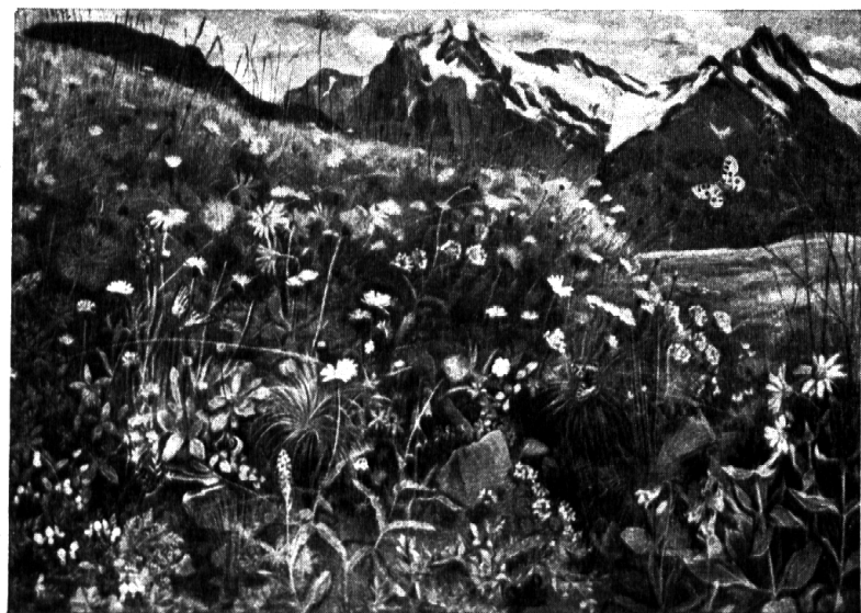
Nr. 22: Hans Schwarzenbach: Bergwiese.