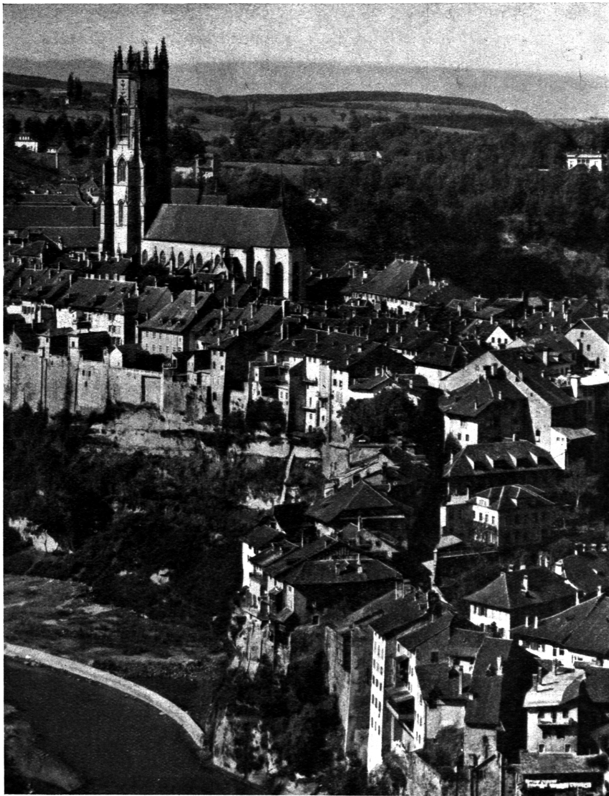
Freiburg: Bourg mit der Kathedrale St. Nicolas (14./15. Jahrhundert).

leur lumière. C'est un des traits les plus frappants et les plus consolants que cette union intime des jeunes avec le Christ, avec le Christ vivant et aimant : selon le mot d'un jeune jociste : « Sans Lui dans le monde moderne nous ne pouvons rien faire, puis-