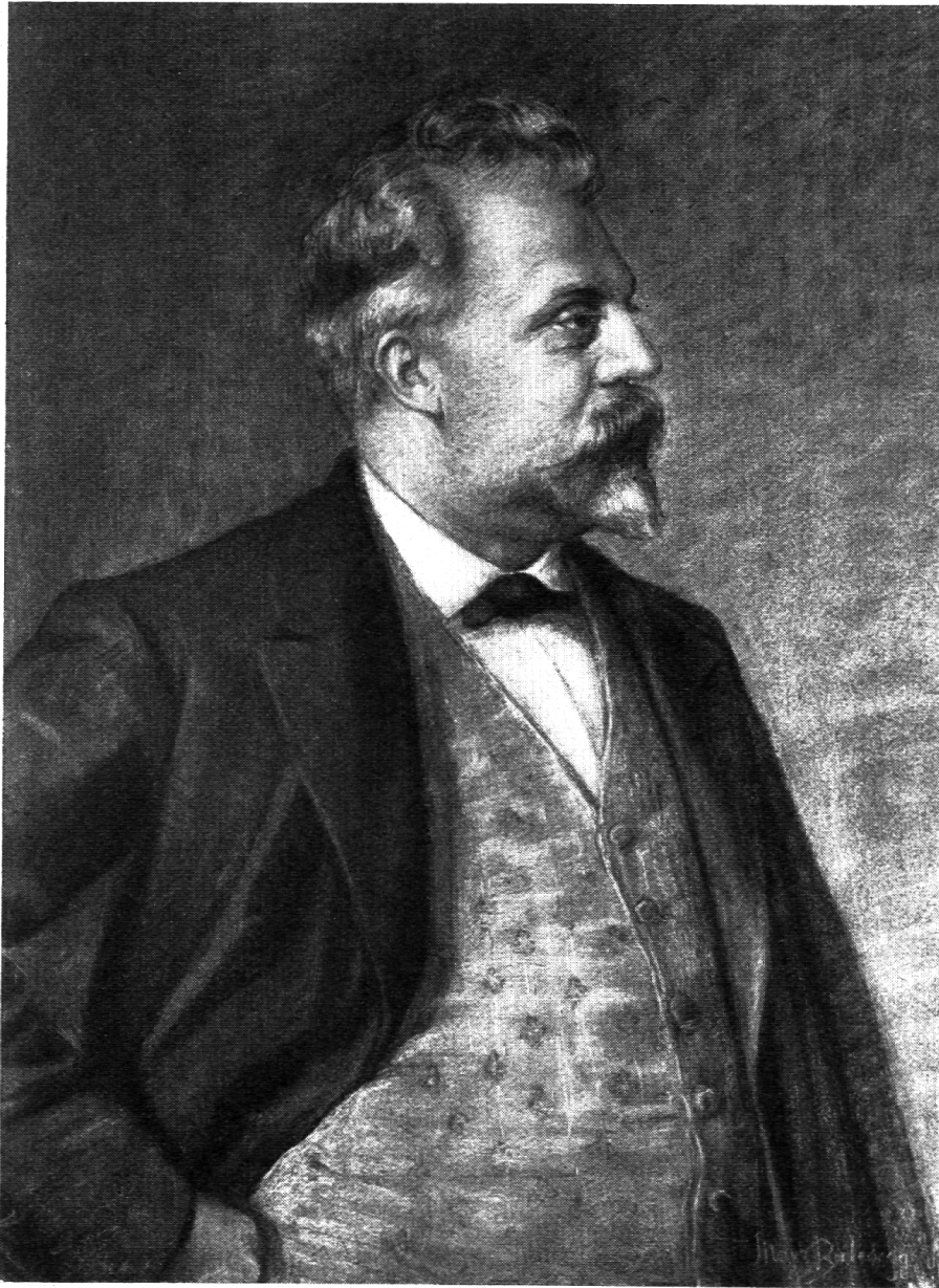
Staatsrat Dr. Georges Python, Gründer der Universität Freiburg, 1856 bis 1927.

tritt, der sie aber doch nicht besitzt . . . weil er sie nicht auch von Grund auf versteht, mit wirklicher Autorität vor das Volk hintreten, ohne sich der Gefahr bewusst zu sein, dass er in der Anwendung der Prinzipien vielleicht doch fehlgehe? Oder auch, dass er sich von aussenher jene bekannte Verkomplizierung des Apparates habe aufdringen lassen, welcher die Ausführung gerade der elementaren Grundsätze der Moral eher erschwert als erleichtert?