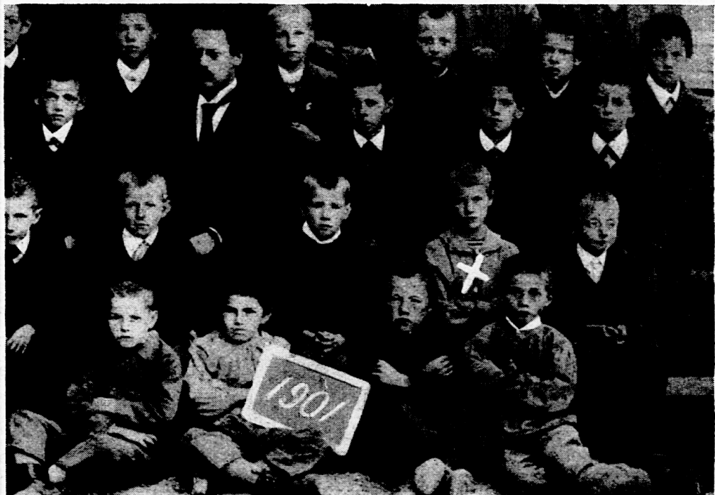
Bundespräsident Dr. h. c. Philipp Etter X

hielten wir Buben zusammen wie ein Volk von Brüdern. Im besondern aber erklärten wir uns, die Buben vom Dorf und jene vom Land oder umgekehrt, gelegentlich den Krieg und übten uns in jungen Jahren schon in den kriegesischen Tugenden der Tapferkeit, des Dreinhauens, hinterlistiger Ueberfälle und zweifelhafter Friedensschlüsse. Wer jetzt mein damaliges Bubengesicht betrachtet, würde meinen, der Knirps hätte nie ein Wässerlein trüben können. So brav und harmlos schaut es drein! Aber ich rufe alle meine damaligen Klassengenossen zu Zeugen dafür an, dass ich um kein Haar besser war als die andern. Wenn wir jedoch in den Bänken sassen, dann bildeten wir die bekannte, geschlossene Gemeinschaft der Bubendemokratie. Und wenn der Lehrer uns