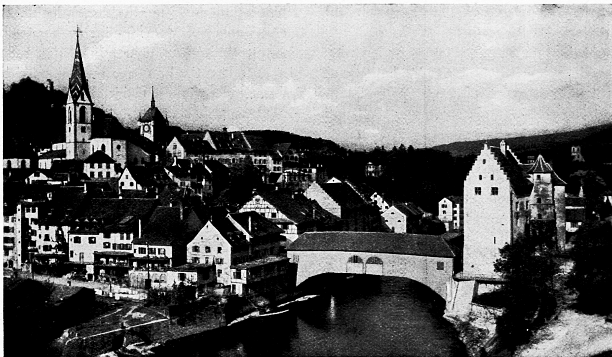
Baden von der Hochbrücke aus. (Landvogteischloss und Holzbrücke, kath. Kirche, Stadtturm, Ruine Stein.)

wochenlang über die Tagsatzungsverhandlungen hinaus zur Kur in Baden geblieben sind.