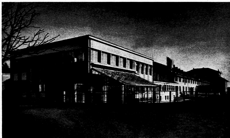
Fig. 2. Südwestansicht des neuen botanischen Institutes. Die beiden hohen Fenster sowie der Kranz der 3 + 5 kleineren Fenster gewähren dem Lichte vollen Einlass in den Hörsaal mit seinen 160 Sitzplätzen. Unter den ansteigenden Bankreihen ist ein Gewächshaus eingebaut, in dessen Glasvorbau schon viele tropische Pflanzen blühen.

gestatteten die Umstände dem freiburgischen Grossen Rat, den Beschluss zu fassen, auch das anatomische Institut zu gründen. Damit besteht vom Herbst 1938 ab für die Medizinstudenten die Möglichkeit, sich in Freiburg auf das zweite propädeuti-