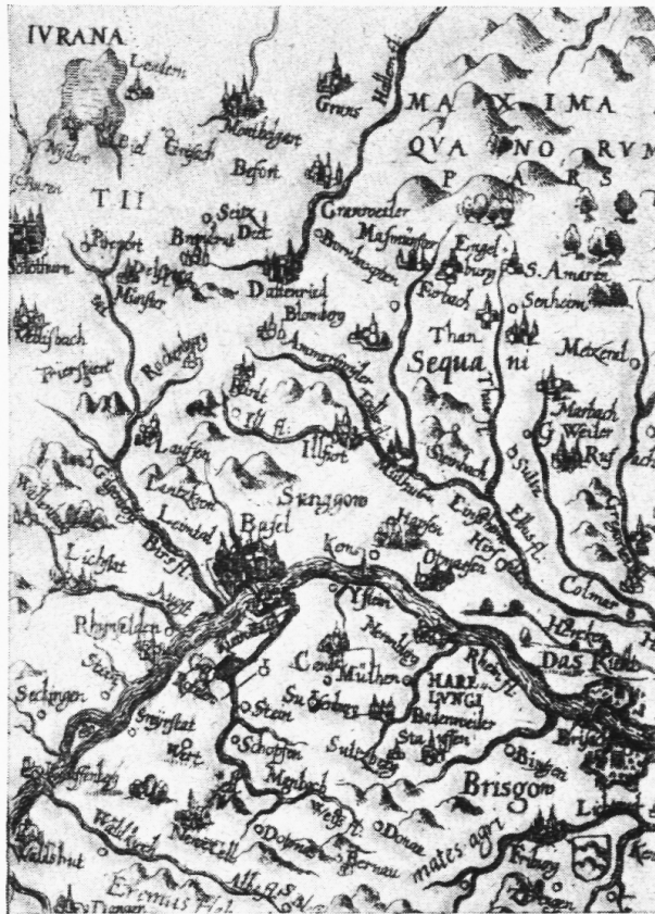
Fig. 2. Linke obere Ecke einer Karte mit der Aufschrift: Abriss ds Reinstroms / welcher gegent zwischen Coblenz und Engers / Marquis Spinola mit Königl: Maystr: in Spanien Kriege Armada übergesetzt / und in Teutschlandt marchirt / desgleichen / wo der Marg-graff von Anspach sich gelagert. etc. Ungef. \frac{3}{4} natürliche Grösse.

tung der Berge von links oben her = Nord-west in Fig. 1 und 3 (die Berge sind Mäusehaufen in Fig. 3, sehr steil in Fig. 2, überaus zierlich in Fig. 1). Die Wälder in Fig. 1 und 2 nicht übersehen!