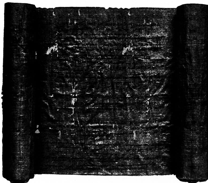
Abb. 1. — Griechische Papyrusrolle des 2. Jahrh. n. Chr. Staatl. Museen Berlin.

Ein Schriftträger, der so geschmeidig ist wie Papyrus, eignet sich vortrefflich zum Rollen (Abb. 1), wobei die Schriftseite (Rectoseite) die inwendige und die unbeschriebene (Versoseite) die schützende Aussenseite bildet. Beim Aufrollen dieses „Buches“ kam dann die Schrift nach und nach zum Vorschein. In der Regel liess man die Schriftlinien nicht die ganze Länge der Rolle