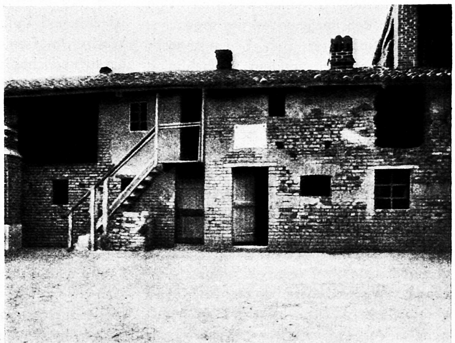
Das Geburtshaus Giovanni Boscos

fröhliches Gemüt und die Tiefe seiner Demut und Sanftmut geschützt hätten. Das alles meisselte am jungen Bosco. „Das Schicksal setzt den Hobel an . . .“ Das Schicksal? Nein, in allem sah Don Bosco klar die Vorsehung Gottes. Auf diese vertraute er in jeder Lebenslage und die Vorsehung wachte über ihm — wie uns das in erschütternden Beispielen aufgeschrieben ist —, wachte über ihn persönlich und über sein priesterliches Werk an der Jugendfürsorge. In Traumbildern sah er übrigens die stufenweise Entwicklung des Oratoriums klar voraus. Wie sollte er da vorzeitig bei scheinbaren Misserfolgen die Flinte ins Korn werfen. Ist somit Bosco nicht ein herrliches Vorbild priesterlicher Ganzheit, die im seelsorglichen Bemühen sich durch nichts von der Beharrlichkeit abbringen lässt! Und noch ein anderer Punkt aus der Taktik Don Boscos liegt der Seelsorge heutiger Zeit und heutiger Verhältnisse nahe. Der Selige suchte die verlorenen Schäflein auf. Er begnügte sich nicht mit der Predigt und der Wertschätzung der guten Presse, sondern leistete die mühselige Arbeit des „Von Mann zu Mann“. So gelang es ihm, viel hundert Seelen zu retten, die ganz der Botmässigkeit des Schmut-