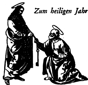
Zum heiligen Jahr

Nähe Denkmal von Albrecht Zwysalg. Beliebtestes und schönes Ausflugsziel für Schulen. Schöne Spaziergänge von Bauen nach Seelisberg, Rütli, Treib. Schöne Spazierfahrt über den See, Tellsplatte, Flüelen etc. Günstige Schiffsverbindung. Gute und billige Mittag- und Zäbligessen. Höfliche Empfehlung A. Ziegler-Zurfluh.