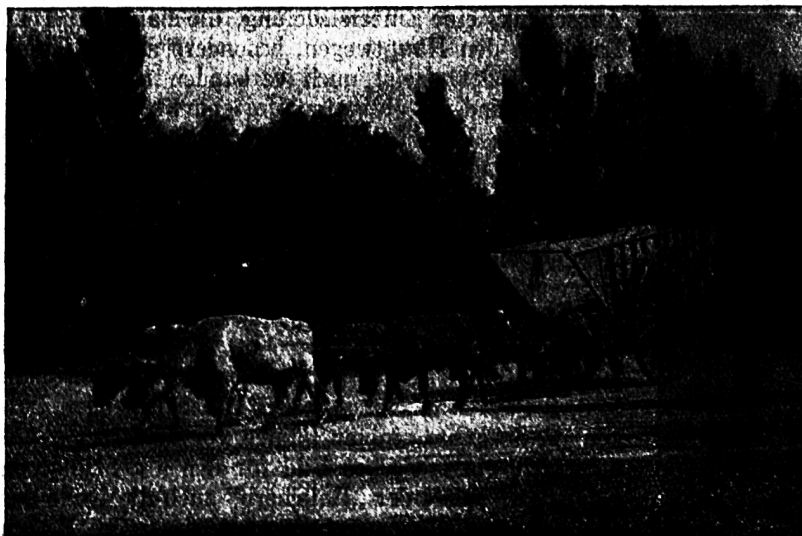
Ochsenkarren in der Pampa. (Die Räder sind von doppelter Mannshöhe. Der Wald verrät die Nähe eines Flusses.)

Die Landstrassen Argentinien, auch der Pampa, sind im allgemeinen in schlechtem Zustande. Vor der Einzäunung der Besitzungen wurde nur in Spuren über die weite Steppe gefahren, die je nach Bedürfnis bald so, bald so verlegt wurden, wenn sich schlechte Stellen gebildet hatten. Auch auf den heutigen zwischen Drahtzäunen laufenden Landstrassen ist keine gradlinige Fahrbahn vorhanden. Es sind unbelegte Naturwege, und da der Pampaboden ein weicher, feinerdiger Lehm ist, so wird die Strasse bei Regenwetter so stark zerfahren, dass von Weg schon gar nicht mehr gesprochen werden kann. Dem hat sich aber die Praxis angepasst. Die Wege sind ausserordentlich breit angelegt, 30—40 m breit, da Land im Ueberflusse