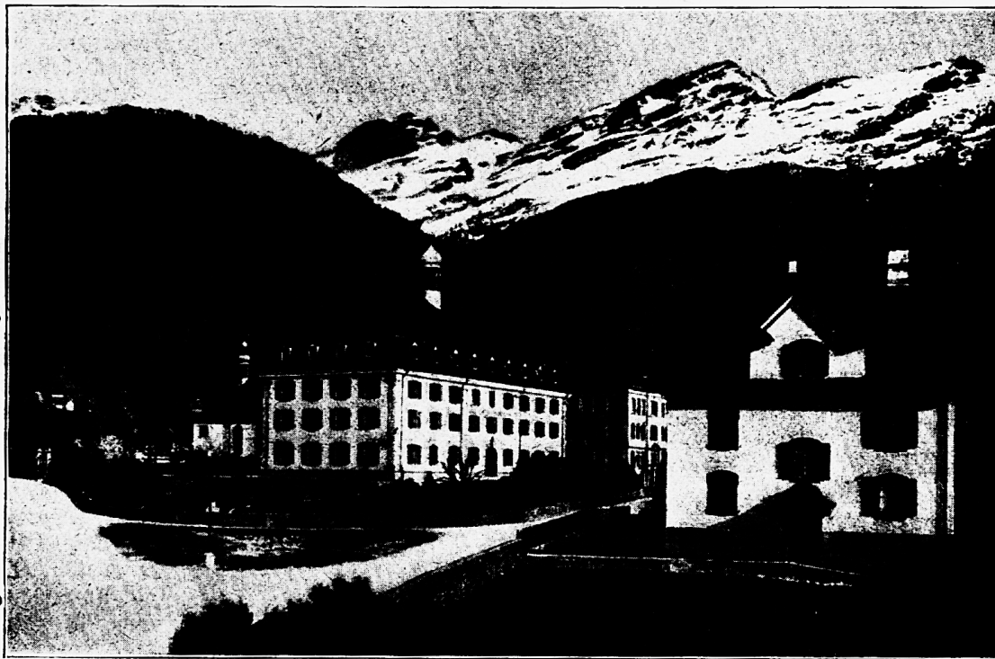
Altdorf, Kollegium Karl Borromäus (1903 erbaut).

Im Lichte der geschichtlichen Entwicklung der ernerischen Schulverhältnisse der letzten Jahrzehnte erscheint die Gründung des Kollegiums durch das Landsgemeindegeseß vom 2. Mai 1902