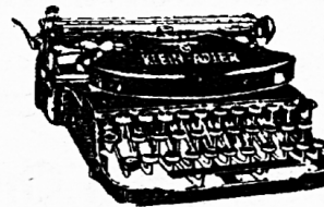
Diese tausendfach bewährte

Zu beziehen durch jede Buchhandlung oder direkt vom VERLAG OTTO WALTER A.-G. OLTEN UND KONSTANZ