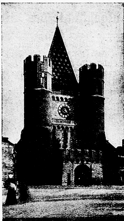
Das Spalentor (15. Jahrhundert) Unter dem Zifferblatt die Muttergottesstatue.

Noch sei der Buchdrucker- kunst Basels erwähnt, die 1471 das erste gedruckte Buch der Schweiz herausgab (zur gleichen Zeit wie Beromünster), nachdem schon ein gewisser „Ludwig zu basel“ im Jahre 1460 einen Kalender mit 32 hölzernen Platten gedruckt hatte. Ums Jahr 1500 herum begegnen uns schon 7 verschiedene Buchdruckerfirmen in Basel, und schon 1488 wurde der erste Buchladen eröffnet. Die Gelehrten der Hochschule und hervorragende Künstler stellten sich nicht selten in den Dienst der Buchdruckerkunst, verdankten sie doch dieser eine rasche Verbreitung ihrer Werke.