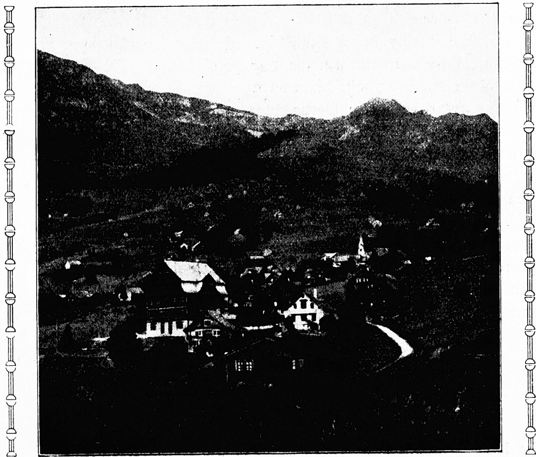
Amden a. Walensee (Schweiz). J