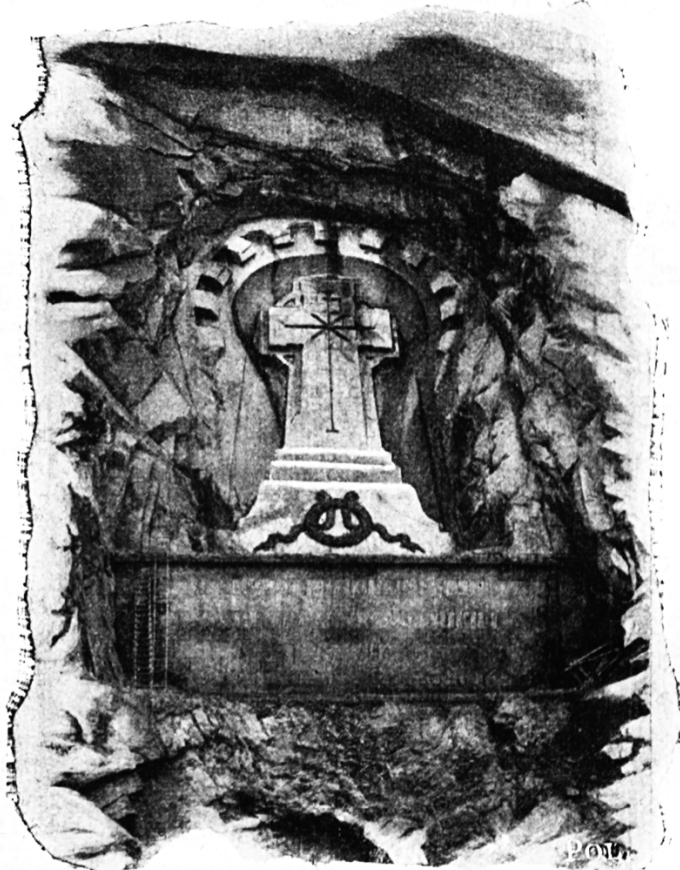
Russen-Denkmal in der Schöllenen.

Mutig und hoffnungsfreudig nun an die Arbeit. Es gilt der kath. Jugend, der Zukunft des kath. Volkes. Eine edle Aufgabe, ein erhabenes Ziel, ein verdientes Unternehmen. Eine Menschenseele finden, heißt es im bekannten Gedicht, ist Gewinn. Eine höhere Aufgabe kennt aber die kathol. Erziehung nicht, als Menschenseelen gesund erhalten, Menschenseelen festigen, Menschenseelen vor Mißgriffen und Irrnissen wahren. Nicht verloren sind freilich die jugendlichen Seelen, die der neuen Erz.-Anstalt anvertraut werden, aber sie treten in die Anstalt, um treu ihrem Glauben erhalten zu bleiben und