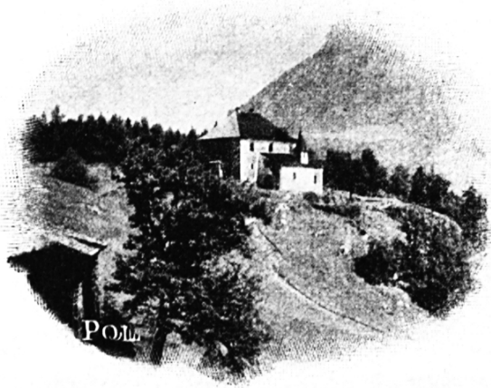
Schlösschen Beroldingen. (Am Wege nach Bauen.)