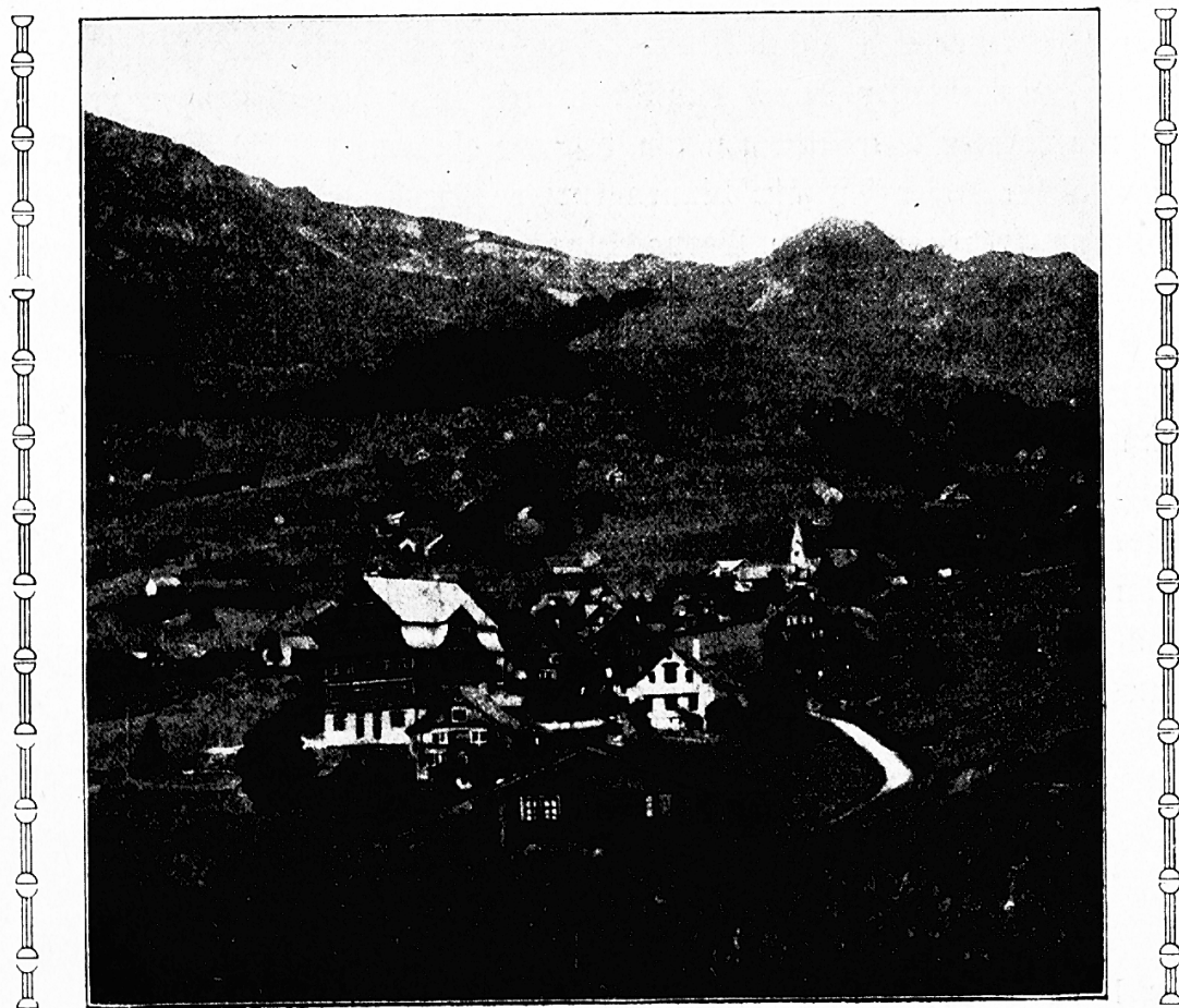
Amden a. Walensee (Schweiz). J