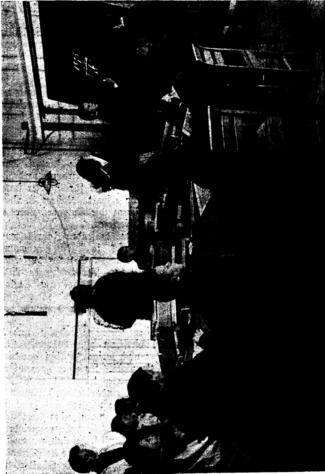
Schulanneum: Klasse der Schwerkörigern.