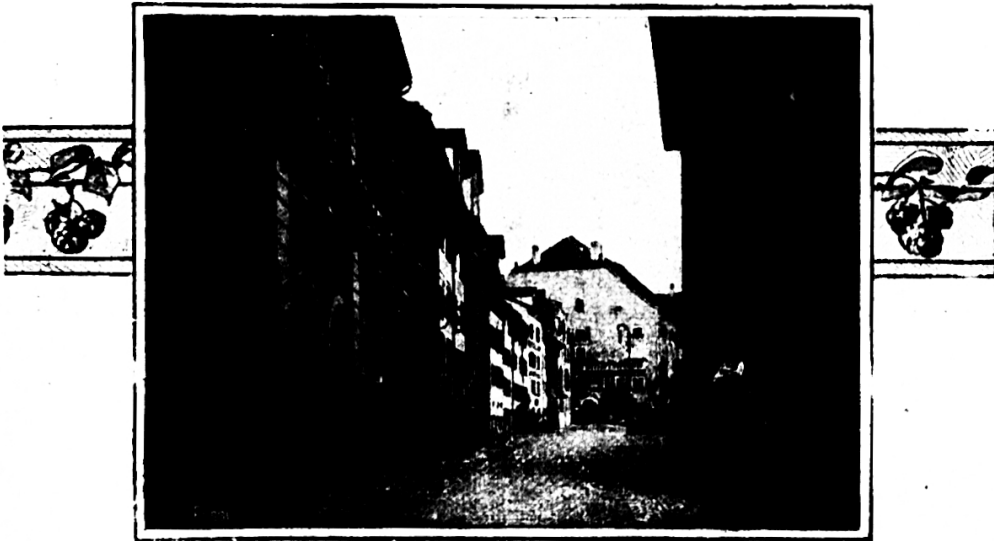
Hofplatz in Wil

Nach dem Verfall des größeren Städtebundes blieb Wil von 1390 bis 1415 im sog. kleineren Städtebunde unter dem Schutze der Stadt Konstanz und wird in Urkunden jener Zeit als freie Reichsstadt aufge-