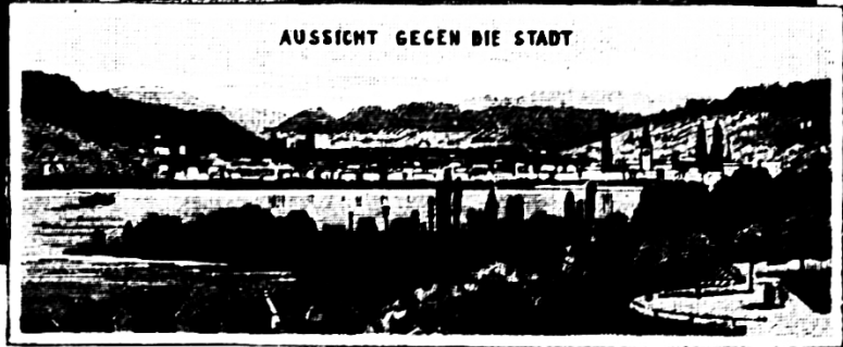
AUSSICHT GEGEN DIE STADT