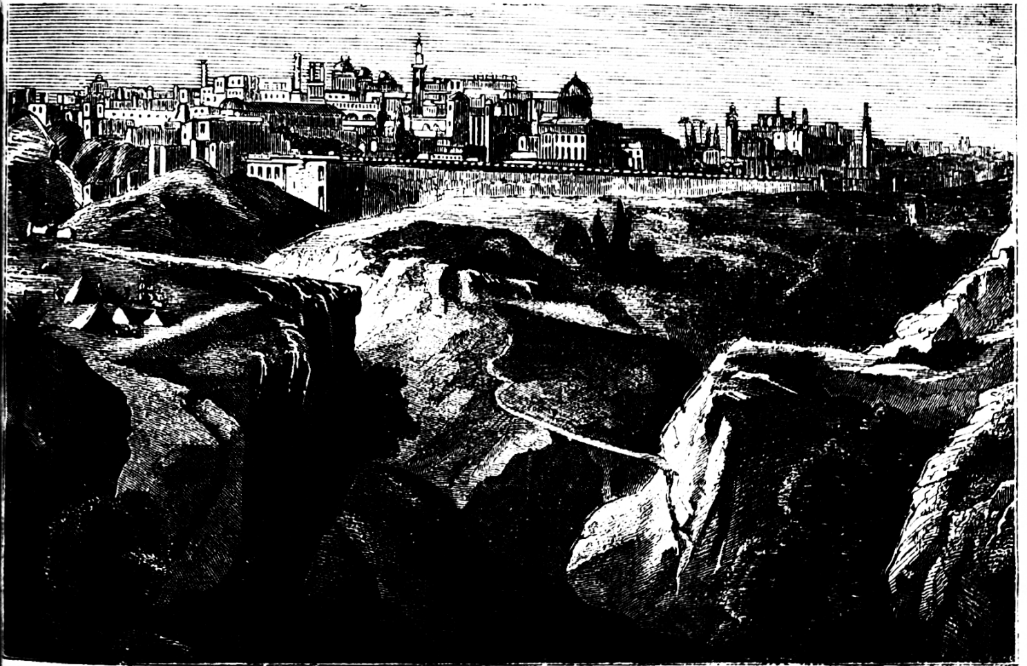
Jerusalem in der Gegenwart.