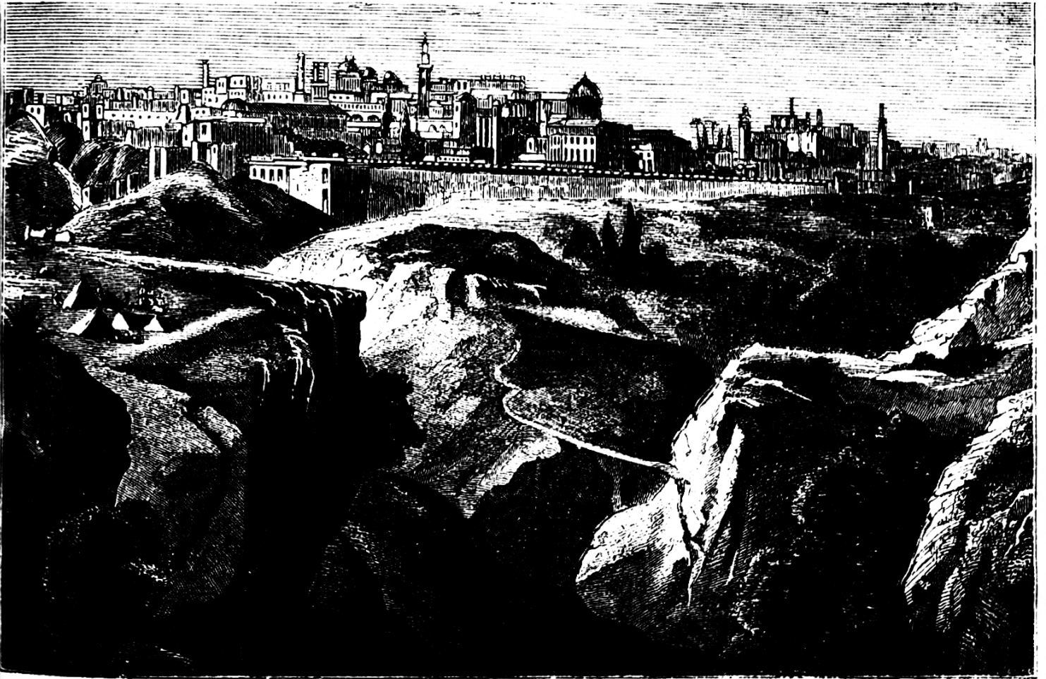
Jerusalem in der Gegenwart.