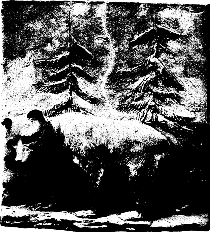
3. Stufe (Knaben von 14–15 Jahren).

für die Seminaristen die Handarbeit obligatorisch zu machen; solange sie aber nicht obligates Schulfach ist, wird dem Wunsche kaum entsprochen werden können. Einsender dies erteilt Unterricht in Knabenhandarbeit und stets mit größerer Freude. Er begrüßt die Stunden als Abwechslung vom mehr theoretischen Schulunterricht; die Schüler zeigen das regste Interesse. Schon die Gegenstände an sich erwecken ihre Freude, noch mehr aber beglückt das Bewußtsein: „das habe ich selbst erstellt.“ Das trifft übrigens bei uns selber ebenfalls zu. Die Disziplin braucht nicht so starr und eisern zu sein. „In der Freiheit zeigt sich der Charakter.“ Ordnung soll ja sein, aber der Schüler kann sich freier bewegen; es herrscht weniger Zwang, mehr freundl. Unterweisung. Der materielle Gewinn ist für den Lehrer nicht geradezu glänzend; immerhin zahlt der Staat (St. Gallen) pro Stunde 65 Rp.; welcher Betrag von den meisten Schulgemeinden auf Fr. 1 erhöht wird. Die Schüler zahlen für Werkzeug und Material ca. 5 bis 6 Fr., wovon dem Lehrer noch ein kleines „Bene“ bleibt. Zu erwähnen ist, daß