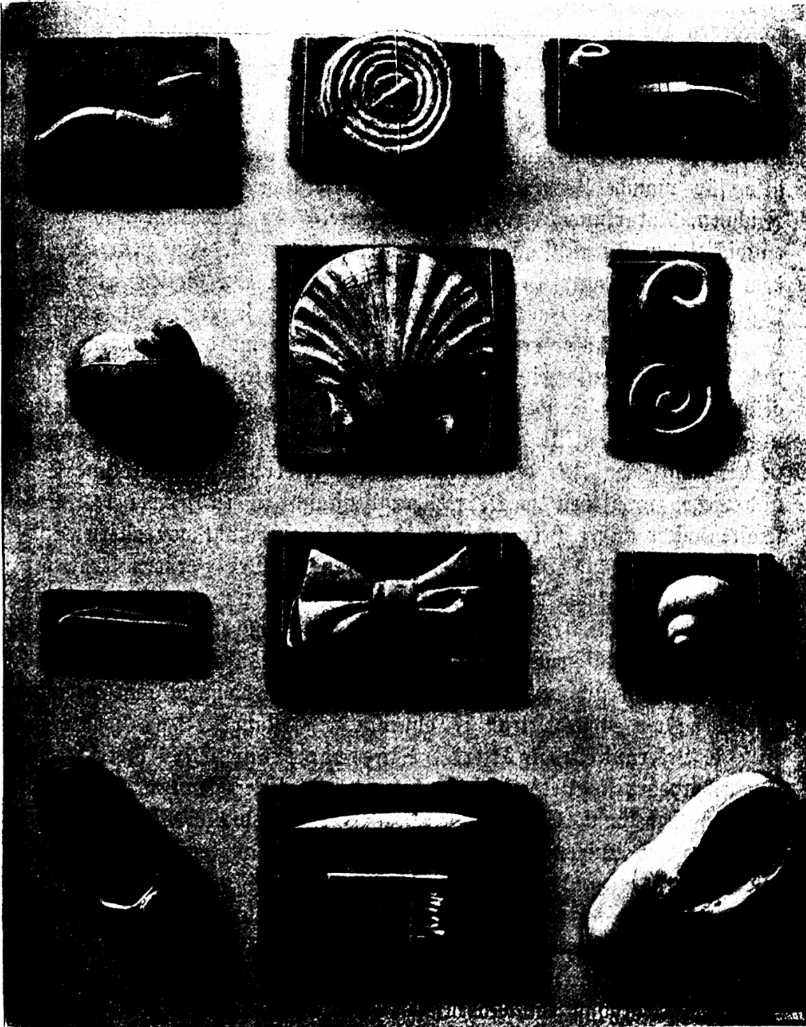
7. 1. Stufe (Knaben von 13 Jahren).

nis. Das sind kurz und gut die vorteilhaftesten Wirkungen der Handarbeit auf den Körper. Es tritt noch hinzu die Übung sämtlicher,