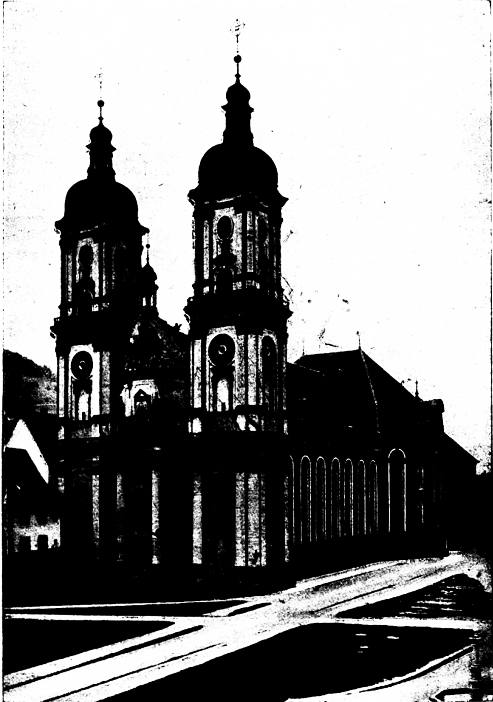
Klosterkirche in St. Gallen.

Abt Gozbert ließ 822—832, der Bedeutung des Ortes entsprechend, eine prachtvolle, dreischiffige Basilika erbauen. Sein Plan für die großartige Klosteranlage wird in der Stiftsbibliothek aufbewahrt. Besondere