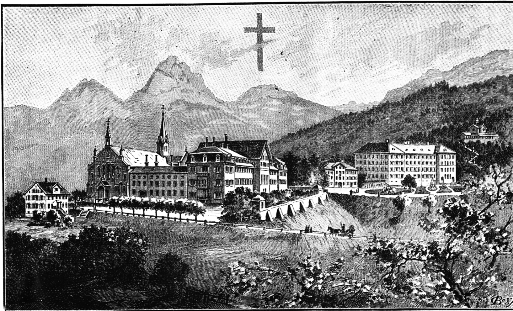
Institut in Ingenbohl.