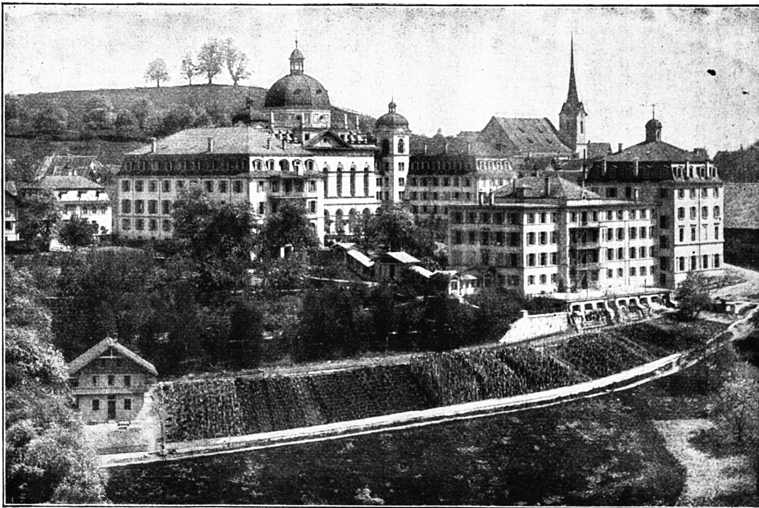
Institut in Menzingen.