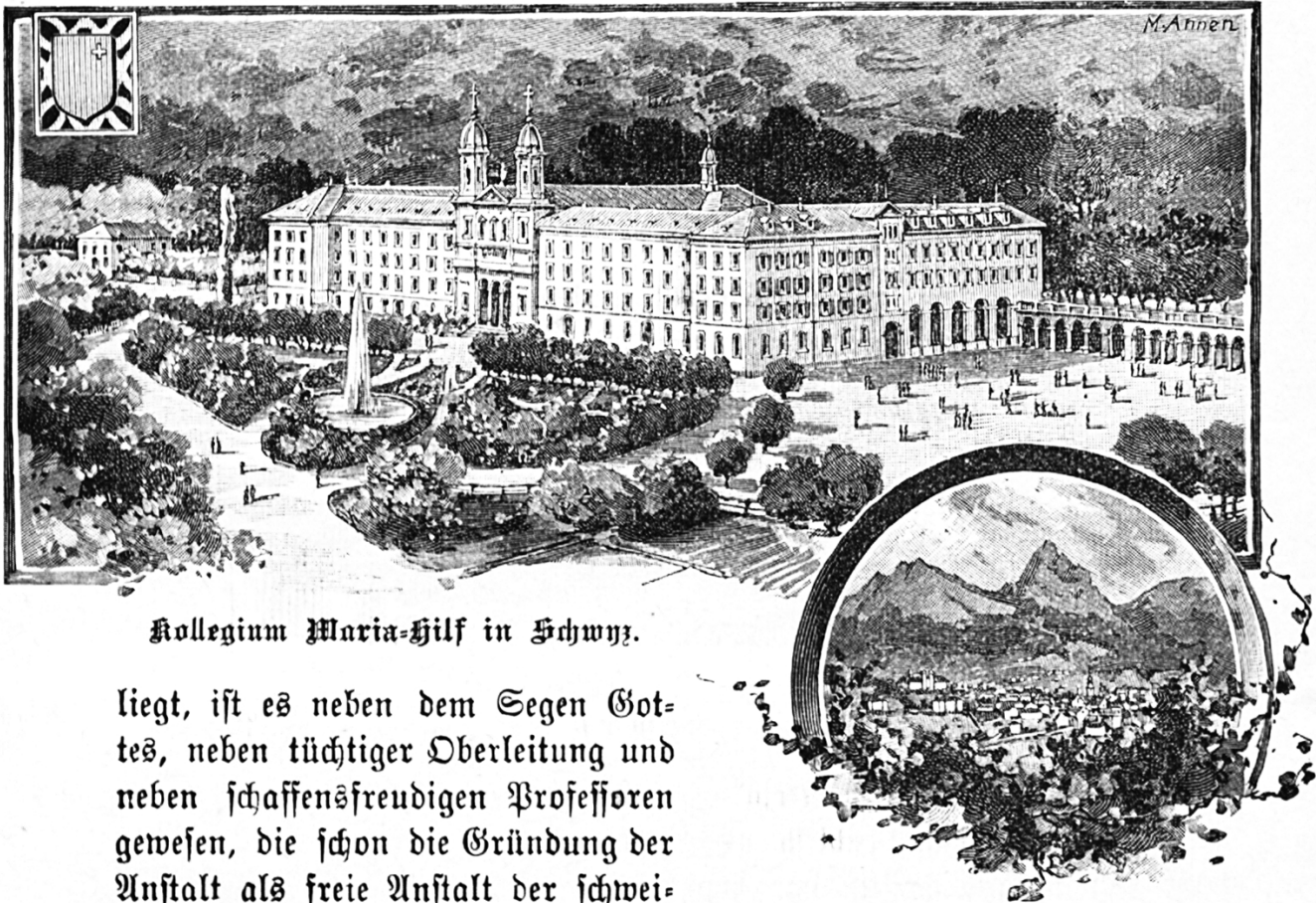
Kollegium Maria-Hilf in Schwyz.

die h. Landesregierung und hat die Gemeindebehörde sich in sehr ansprechender und taktvoller Art am Jubelanlasse beteiligt. Denn man weiß in den kath. Kantonen doch den geistigen und materiellen Wert freier kath. Lehranstalten noch zu schätzen, wie man auch fest und freudig an der Unterrichtsfreiheit fest halten will, die das Dasein und die großartige Entwicklung eines Kollegiums Maria-Hilf innert 50 Jahren zu heutiger staunenswerter Blüte ermöglichte. Diese Unterrichtsfreiheit, die im Sinn und Geiste der großen Mehrheit des urschweizerischen Volkes