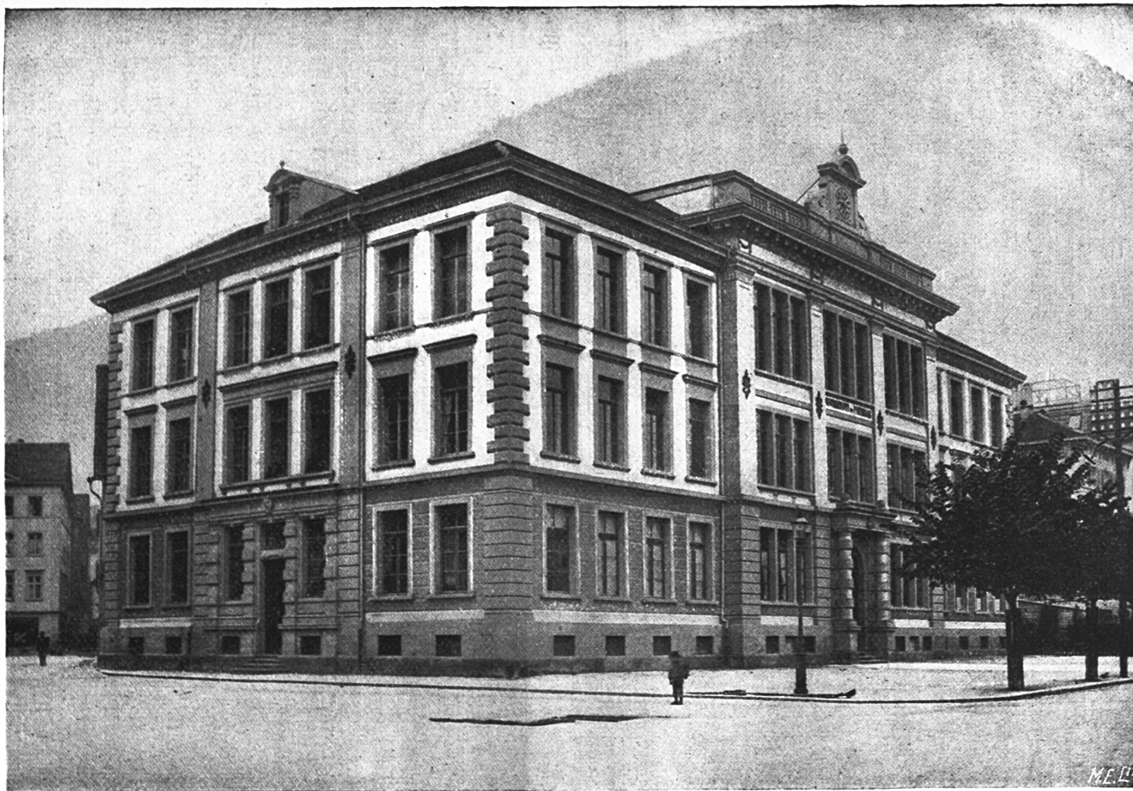
Schulhaus in Chur.