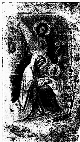
No. 9000 W

Preis: 25 Stück Mark 1. — (Fr. 1.25). Größe: 6 \times 9 cm.: No. 78104 W (16 verschiedene Darstellung.) Vergoldete Spitzen. — Größe: 6\frac{1}{2} \times 10\frac{1}{2} cm.: No. 7000 W (16 verschied. Darstellungen) Spitzen. — Größe: 7 \times 11\frac{1}{2} cm.: No. 78108 W (16 verschiedene Darstellungen) Durchbrochen. — Größe: 4\frac{1}{2} \times 10\frac{1}{2} cm.: No. 98000 W (16 verschiedene Darstellungen) Spitzen, länglich. — Größe: 7 \times 12\frac{1}{2} cm.: No. 9000 W (16 verschiedene Darstellungen).