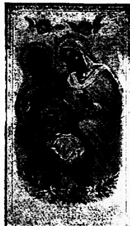
No. 88002 W

Preis: 25 Stück 80 Pfennige (Fr. 1. —). Größe: 5\frac{1}{2} \times 10\frac{1}{2} cm.: No. 78126 W (16 verschiedene Darstellungen) Farbige Spitzen. — Größe: 7 \times 11\frac{1}{2} cm.: No. 5819 (4 verschiedene Darstellungen) Querformat, Text nur Vorderseite.