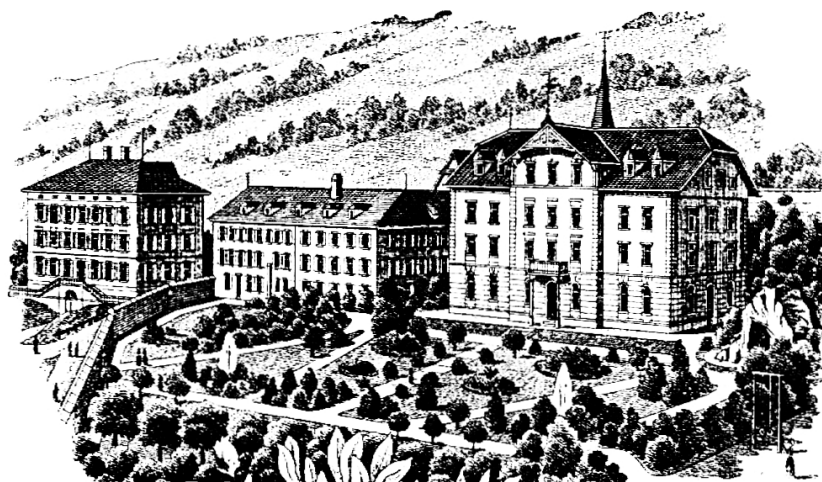
Töchter-Pensionat Maria-Opferung in Zug

taubstumme Kinder Stipendien. Das Lehrpersonal hatte fünf Sitzungen, in denen 20 Beschlüsse abgewickelt wurden. Liebesgaben gingen an bar 2728 Fr. 70 Rp. ein, daneben aber noch ein ganz bedeutendes Quantum allerlei nützlicher Effekten. Dem Kataloge ist eine fünfzehnsseitige Arbeit des v. Herrn Direktors beigegeben, betitelt „Psychisch-sprachliche Entwicklung des vollsinnigen und des taubstummen Kindes bis zum Schulalter“. Wir entnehmen gelegentlich der psychologisch tiefen und praktisch sehr eingreifenden Arbeit dies und das und empfehlen sie der bedächtigen Lektüre all' derer, die Gelegenheit haben, dieselbe zu genießen.