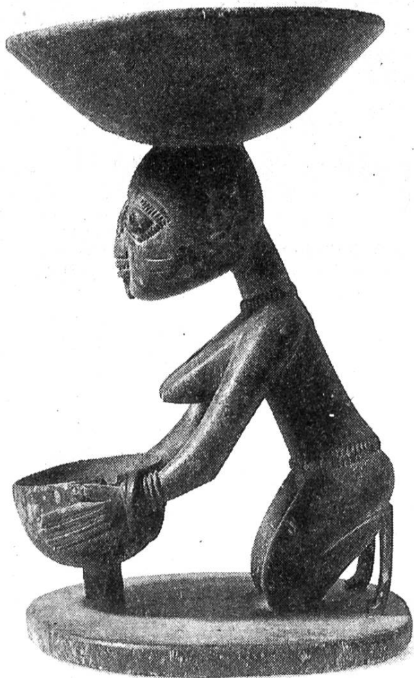
Schale zur Aufbewahrung der Palmkerne, die für das Orakel wichtig sind.

Es wird auf jeden Fall eine Einladung mit allen erforderlichen Informationen verschickt.