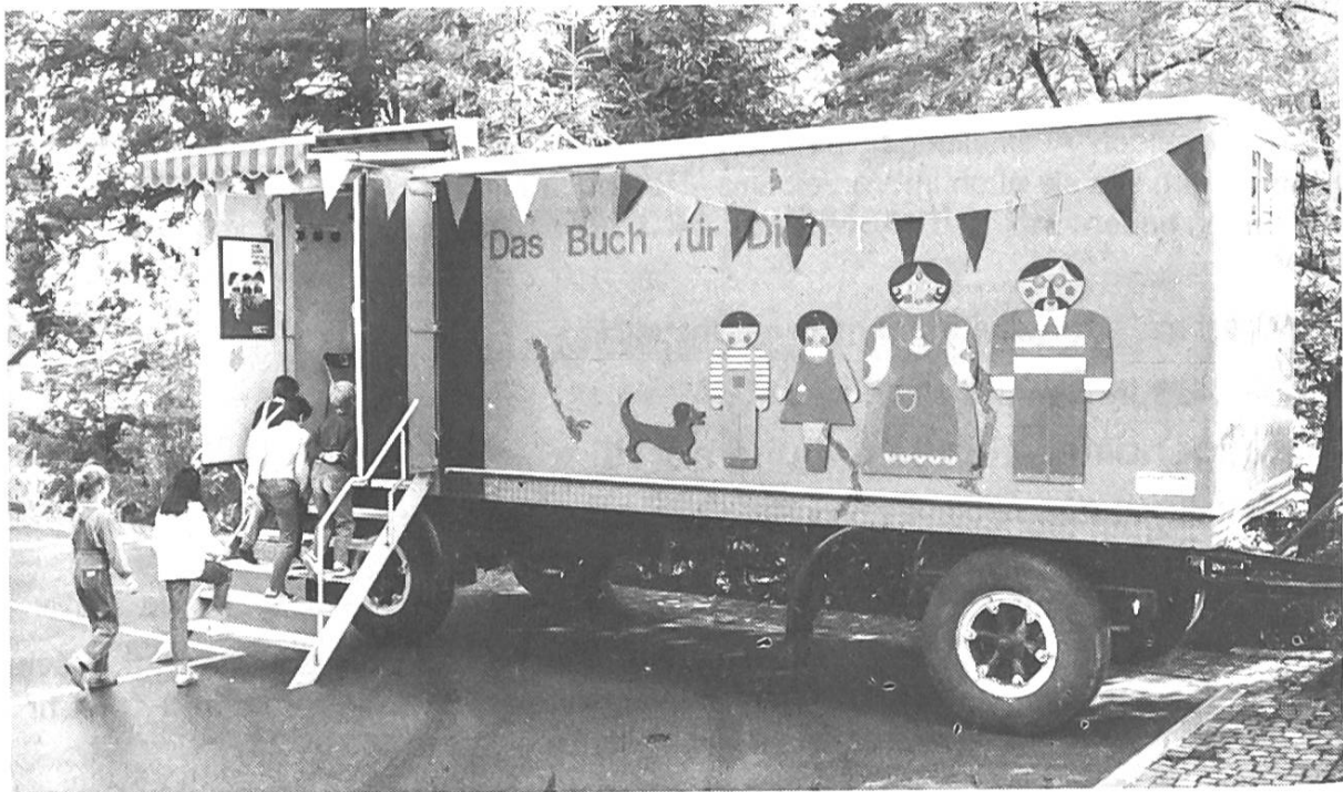
Jugendbuchausstellung 1987 zu Wasser und auf Rädern

Voranmeldung für Schulklassen ausserhalb der aufgeführten Schulhäuser: Pestalozzianum (Frau Boffa), Telefon 01 / 362 04 28.