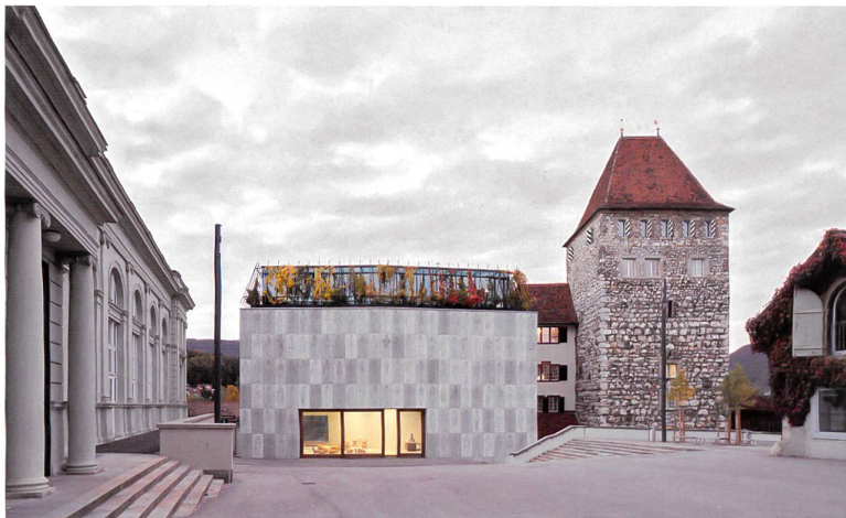
Altes, neues Museum: In der verglasten, begrünten Attika liegen die Büros.

Der im April 2015 eingeweihte Neubau erstreckt sich über vier Geschosse (UG: Foto- und Filmraum; EG: Foyer; OG: Ausstellungssaal; DG: Verwaltung). Die Raumhöhe einer Ebene entspricht jeweils derjenigen von zwei Etagen im West-