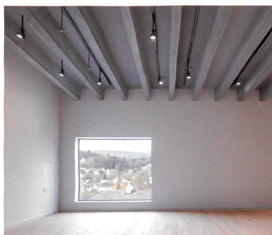
Stützenfreier Ausstellungsraum im 2. OG, mit Blick auf den Jura.

Mehr Bilder, Pläne und Infos gibt es unter www.espazium.ch/tec21