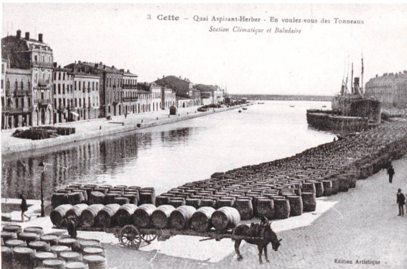
Weinfässer am Quai Aspirant Herber, 1928.