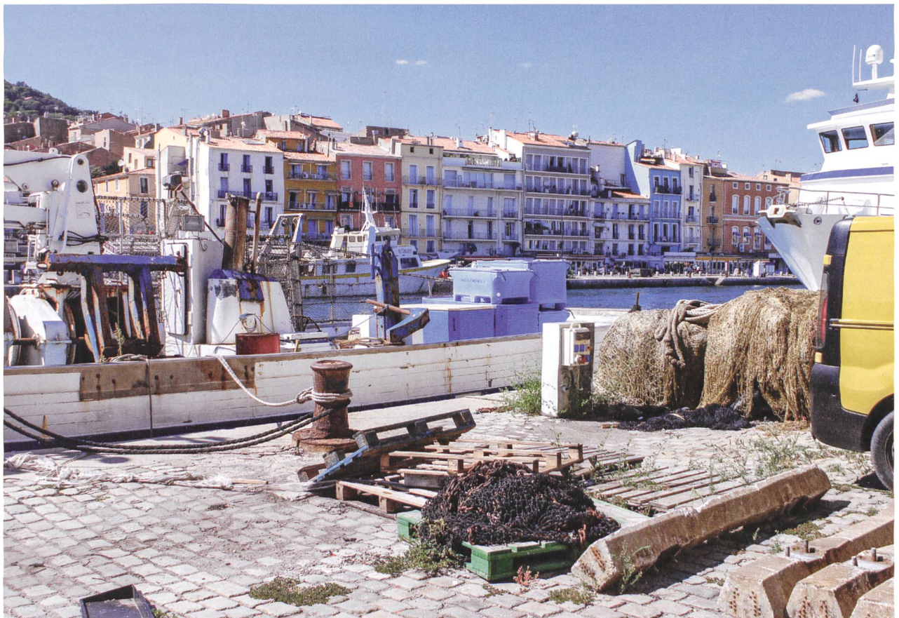
Von der Fischerei genutzte Räume im Zentrum der Hafenstadt Sète, 2016.

Von ihm geht der zweite Diskurs aus. Er ist nach aussen und nach vorn gerichtet und hat den Freizeithafen im Blick. Viel Geld ist in den letzten Jahren in seine Erweiterung geflossen, von der man sich neue Einkommensquellen verspricht. Erneut sind es «die Anderen», Fremden, Reichen, die man sich herbeiwünscht, um die lokale Wirtschaft anzukurbeln. Dabei