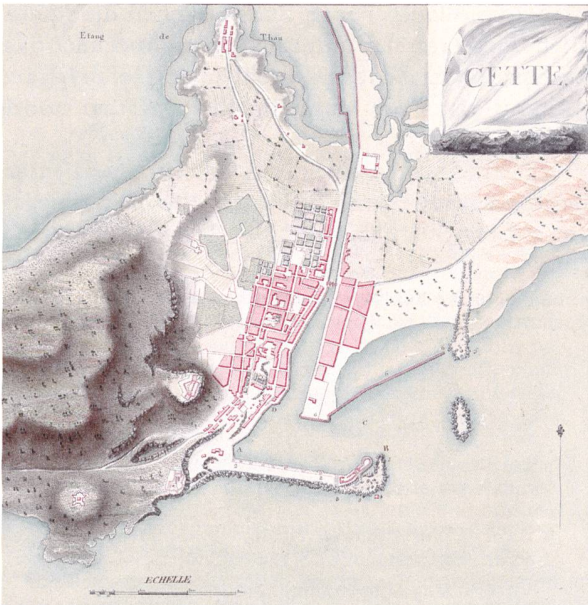
Karte der Hafenstadt Sète von 1777.