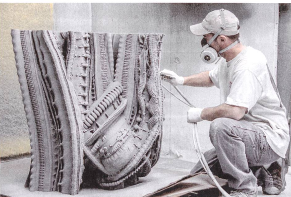
Die Produktion von «Digital Grotesque»: Vor allem komplexe Bauteile können mit 3-D-Druck um ein Vielfaches schneller als mit herkömmlichen Verfahren produziert werden.

müssen nicht mit einem Drucker produziert werden. Es wäre vielleicht auch noch zu früh, das Ziel zu haben, ein Haus in einem Stück zu drucken. Architektur ist und bleibt eine Assemblage von verschiedenen Systemen, Gewerken und Materialien, die zusammengefügt werden müssen. Da würde ein 3-D-Drucker, der alles auf einmal drucken kann, keinen Sinn ergeben. Mich interessiert eher die Frage, wie sich 3-D-Druck mit anderen Verfahren kombinieren lässt. Der Idealfall wäre meiner Meinung nach, dass Häuser nicht mehr auf Standardisierungen angewiesen sind, sondern zunehmend spezifisch und individuell gestaltet werden können. Das sind gewichtige Argumente dafür, dass digitale Fabrikation – und im radikalsten Fall 3-D-Druck – eingesetzt werden.