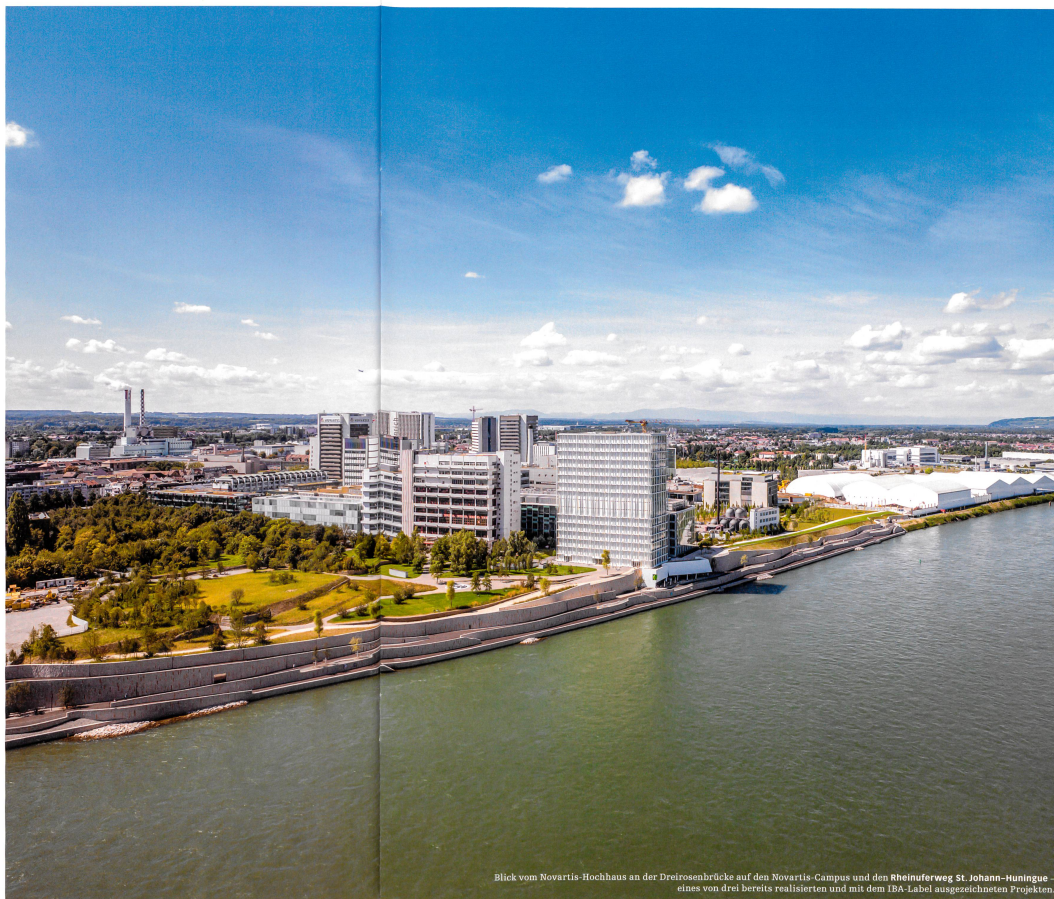
Blick vom Novartis-Hochhaus an der Dreirosenbrücke auf den Novartis-Campus und den Rheinuferweg St. Johann–Hüniguel – eines von drei bereits realisierten und mit dem IBA-Label ausgezeichneten Projekten.

Sehr unterschiedlich. Das IBA-Team umfasst hoch qualifizierte Fachleute aus diversen Bereichen: Architektur, Raum- und Stadtplanung, Soziologie, Kommunikation etc. Es ist ein heterogenes Team, das die Projekte heterogen angeht. Wir arbeiten inter-